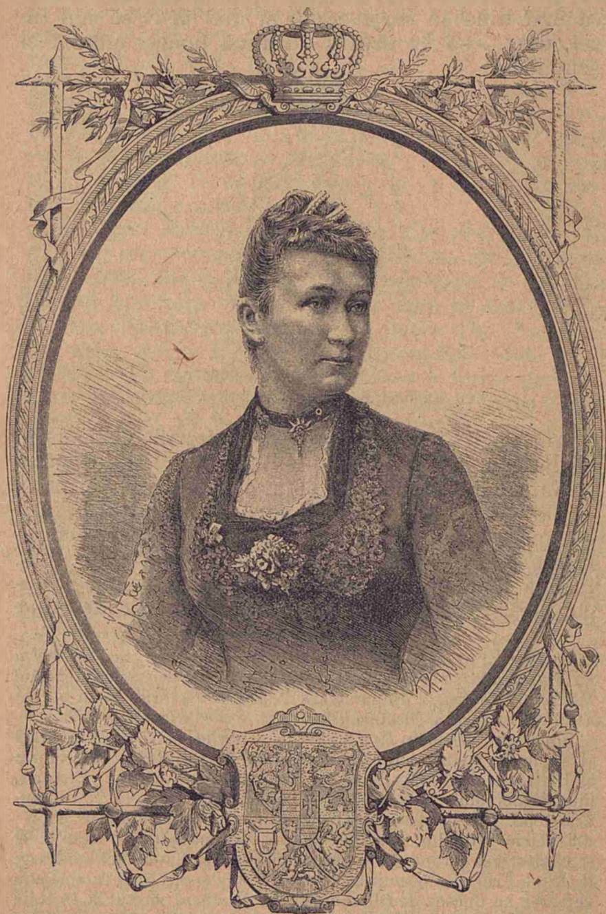
M. S. Augusta Victoria, împărăteasa Germaniei.