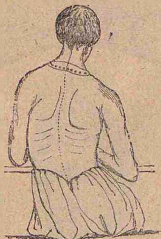
Una din pozițiile rele ale școlarilor la scris.

moasă și mai repede. Aicea au dreptate. Dacă însă ar fi să alegem întru ceea ce spun igienisții, am zice că mai bine să scrie copiii și mai urât și mai încet, dar... să fie scutiți de două boale: miopia și scholiosa.