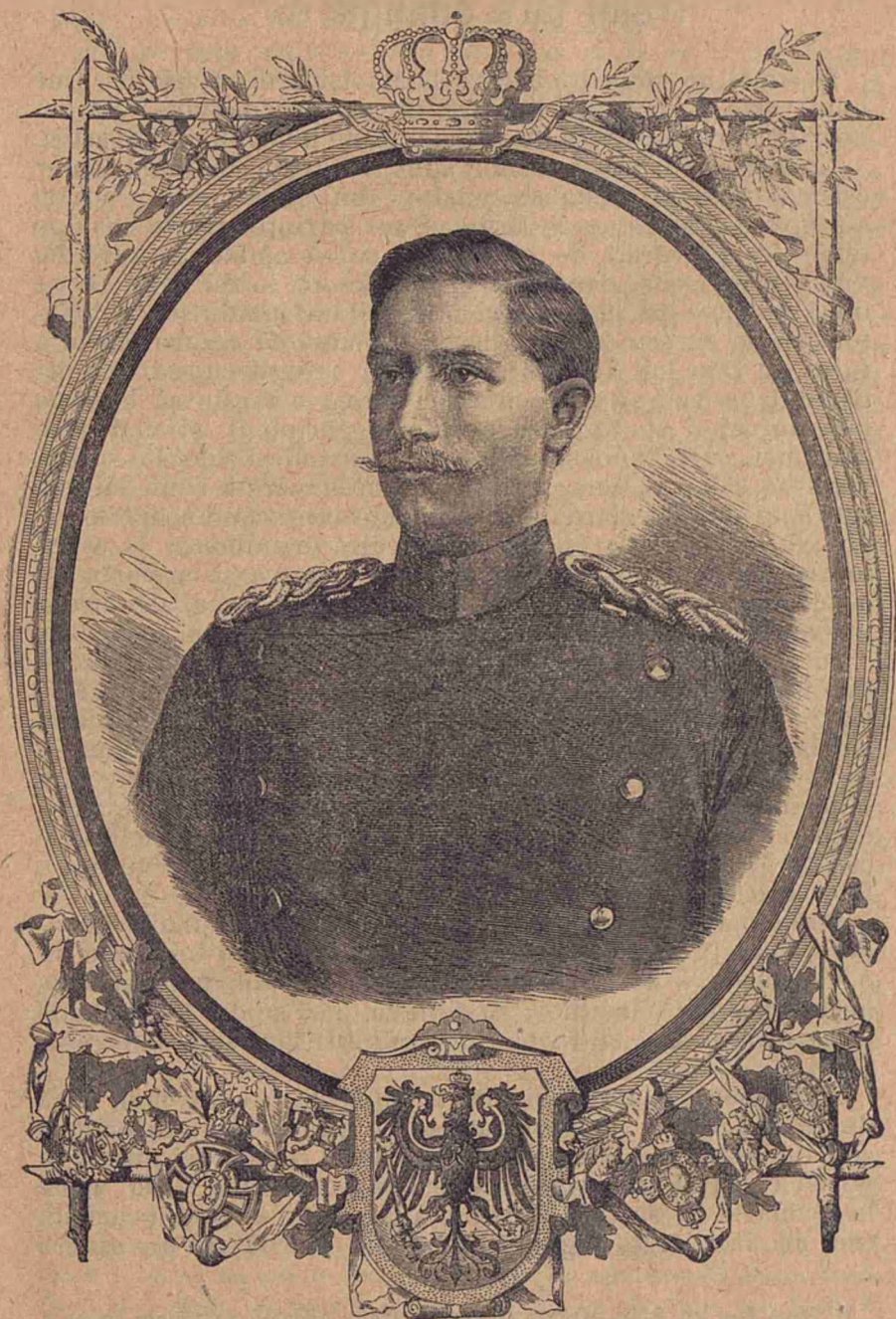
M. S. Wilhelm II, împăratul Germaniei.