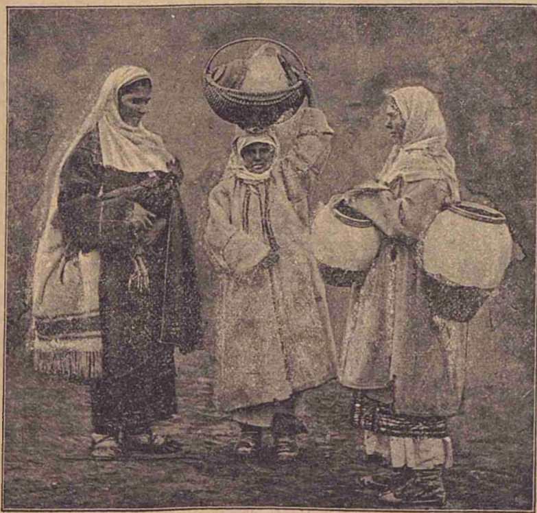
Costume de femei din jud. Muscel.