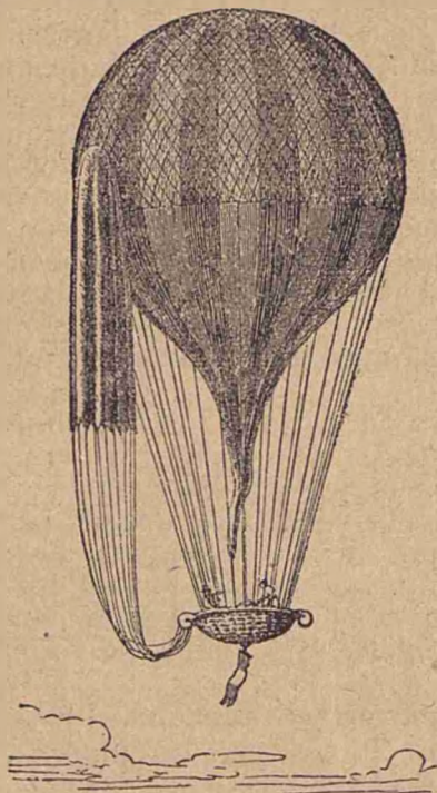
Balon în forină obișnuită.

Dar... balonul începe să devie mai greu decât aerul și să se coboare. Nu mai aveau ce să arunce; deci sunt siliți să pue capăt călătoriei. La 10\frac{1}{2} sunt pe pământ în Ungaria în orașul Kirchdrauf.