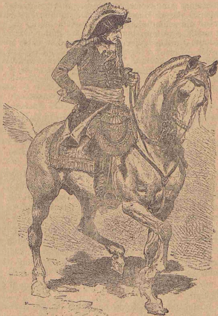
Impăratul Frederic cel Mare.

obiceiului obștesc, apoi coada la ei are o însemnătate politică și e un simbol al iubirii de tron și de dinastie astfel că cine ar îndrăzni să-i taie coada, ar face o îndoită crimă și socială și politică. De o parte ar fi un inovator în obiceiurile vechi, și tocmai între Chinezi să te apuci de ino-