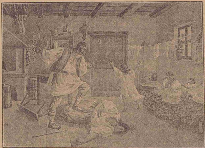
A înnebunit bețivul.

Nu poate fi minte omenească în stare să înțeleagă așa grozăvie, decât zicând că criminalul a fost nebun.