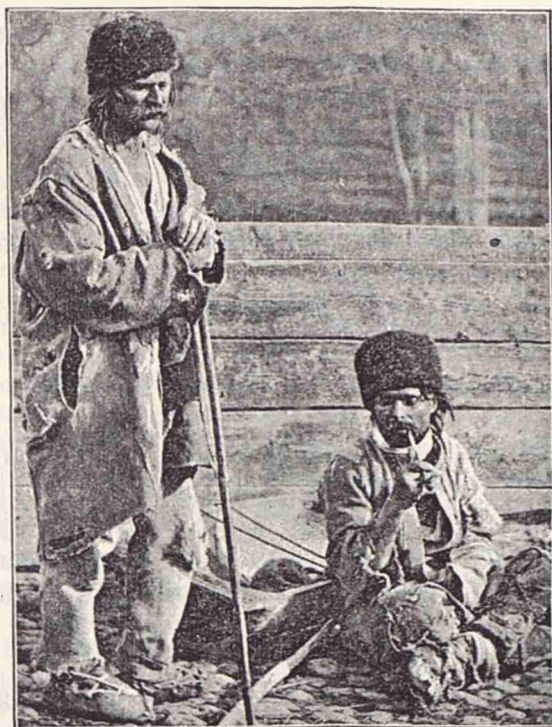
Țigani nomazi din împrejurimile orașului Oltenița.

«Mă aflu în Sigmaringen, pe marginea tinerei Dunăre, și mă gândeam la copiii cari au părăsit acest castel, avântându-se în lumea largă și făcând să sângere inima iubitoare a mamei. În Sigmaringen erau născuți toți acești copii frumoși, cu trăsături fine, regulate și cu inimile nobile grave. Pentru că serioși erau toate vlăstarele Hohenzollernilor, ca și patria lor, care e zâmbitoare ca Rinul și are ceva cu totul grav, aproape posomorit, aspru».