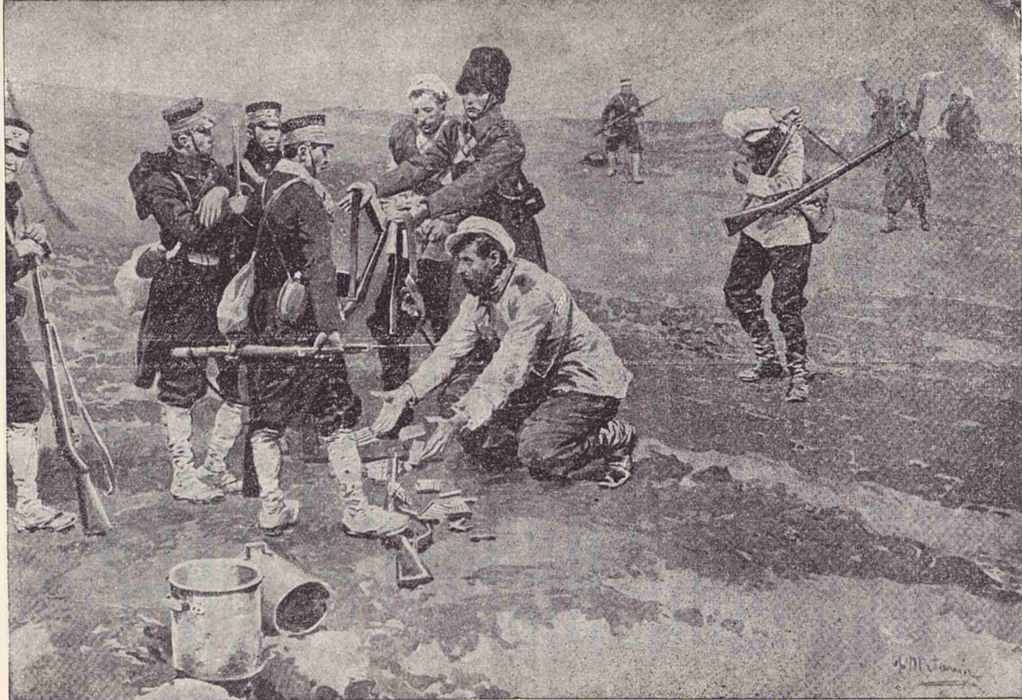
Soldații ruși, predându-se la posturile de antegardă japoneză, (După Buletinul Armataei și Marinei).