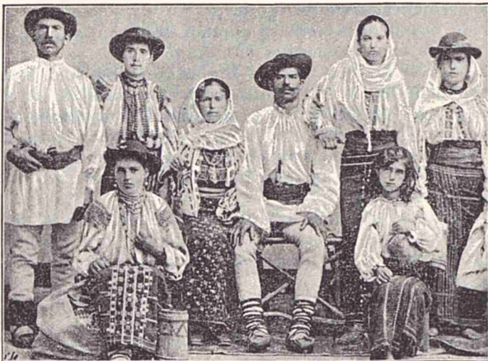
Costume din jud. Muscel, regiunea Rucărului.