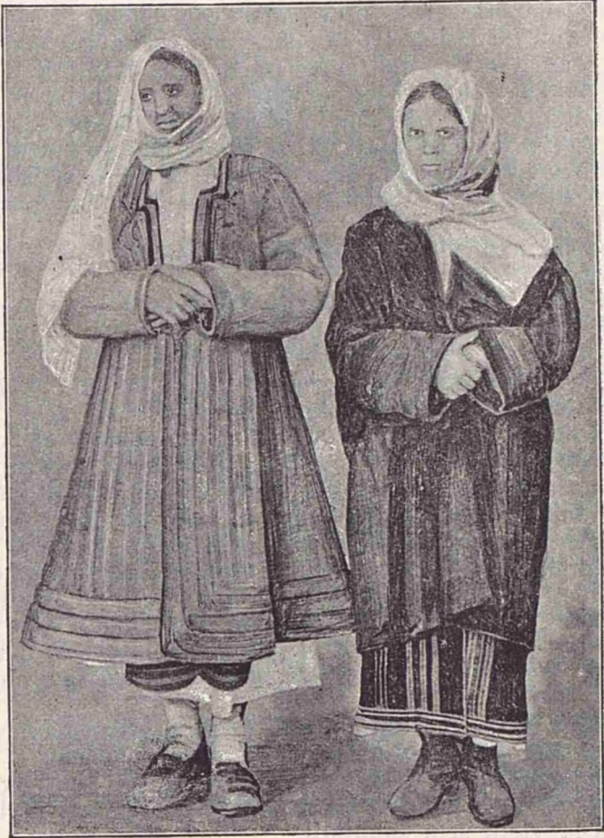
Costume femești din jud. Teleorman și Vlașca.