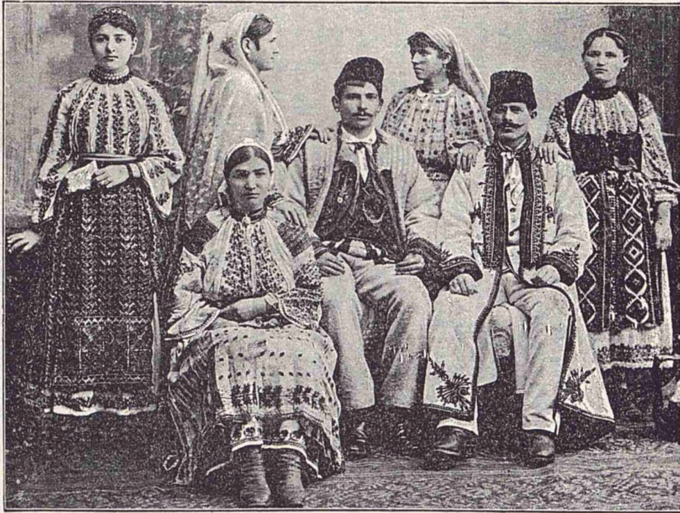
Țărani și țarance din jud. Mehedinți, îmbrăcați în haine de sărbătoare.