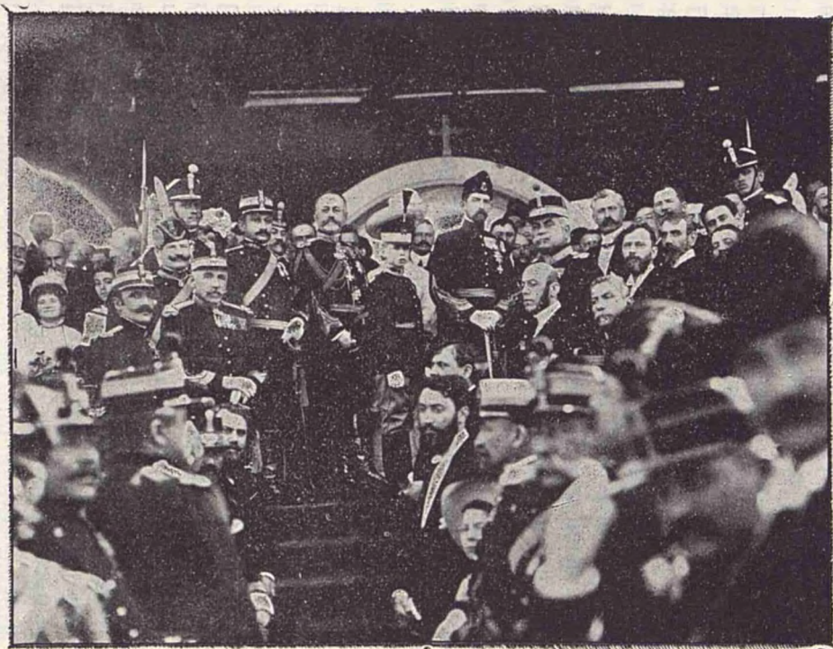
AA. LL. RR. Pr. Ferdinand și Carol în pavilionul dela șosea (București) privind la defilarea cortegiului istoric.