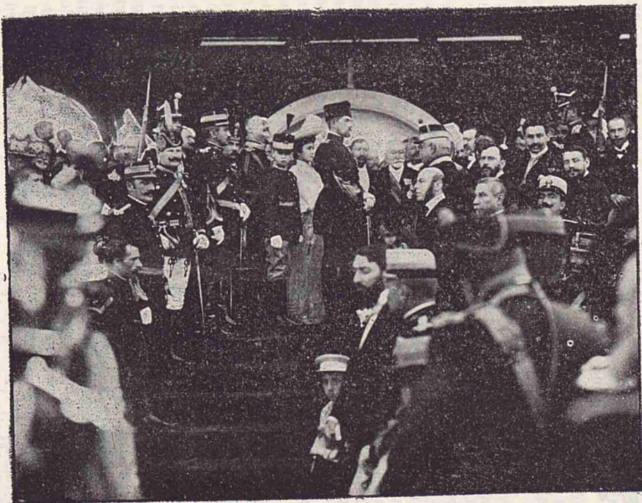
AA. LL. RR. Pr. Ferdinand și Carol asistând la serviciul divin al pomenirii lui Ștefan cel Mare în pavilionul din piața Victoriei din București, în ziua de 2 Iulie 1904,