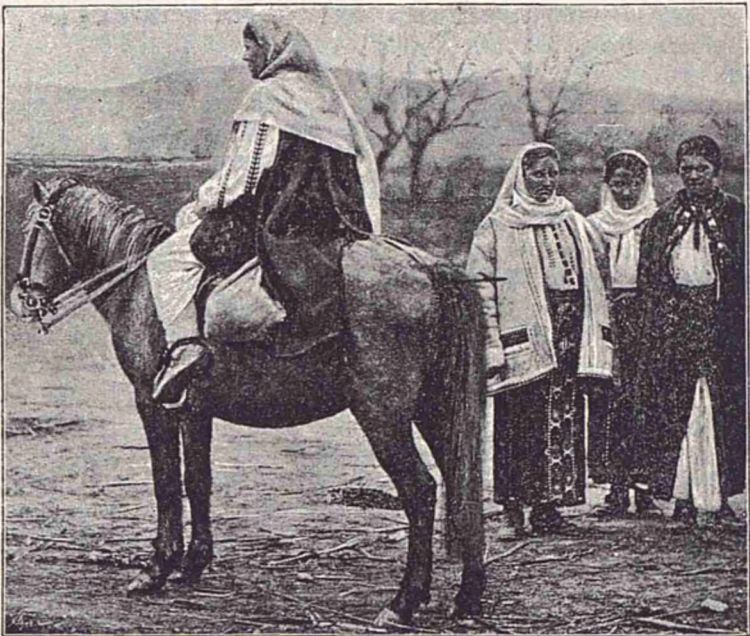
Costume femești din jud. Muscel.

În acest tablou se vede frumosul costum femeesc din Muscel, și mijlocul practic de a se transporta acest sex prin locurile puțin practicabile ale județului.