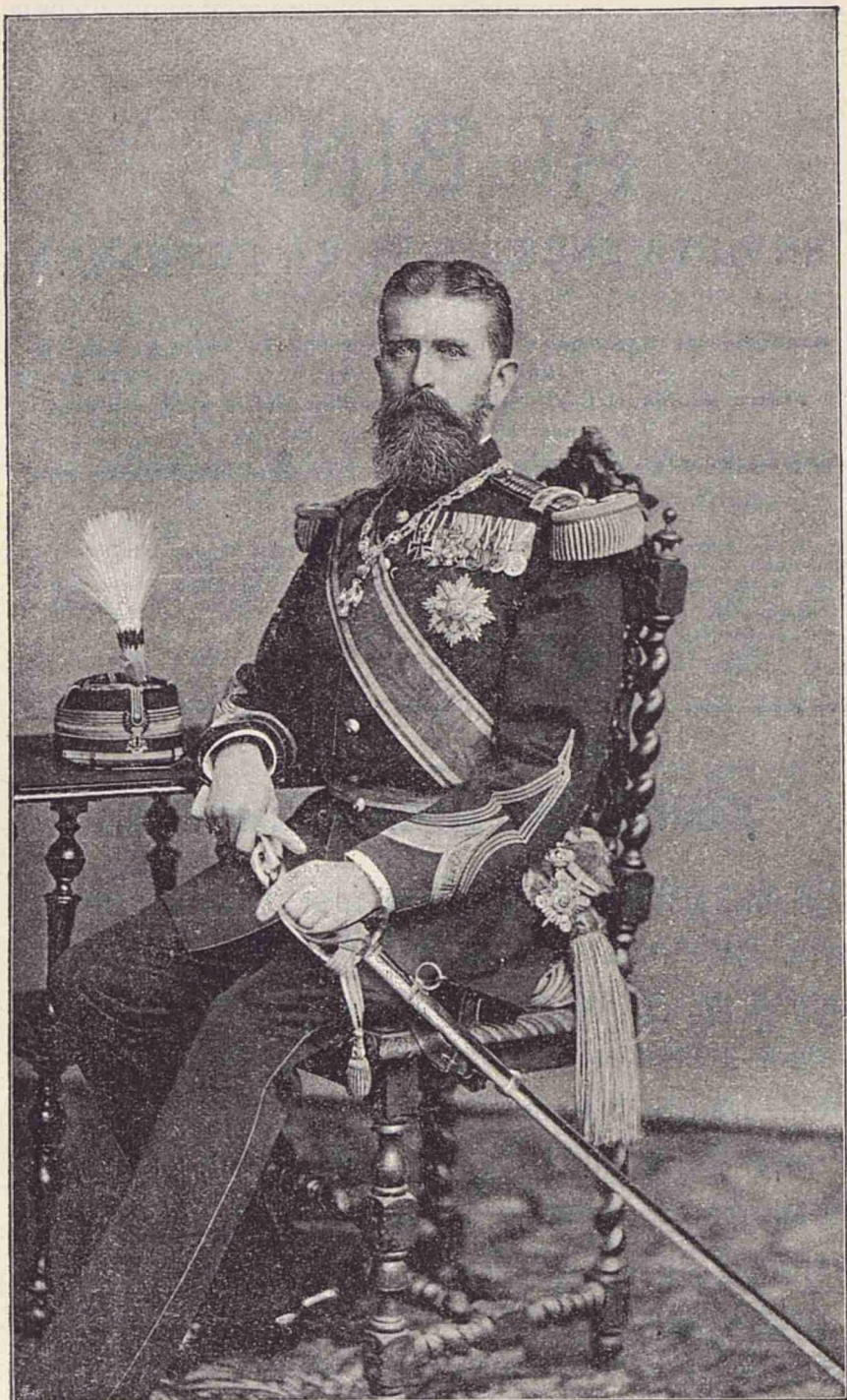
Principele Leopold de Hohenzollern.