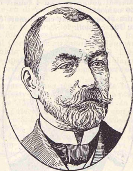
Rodjestvensky, comandantul flotei Rusești.

De acum stăpânirea Mărei e în mâna Japonezilor, cari dacă pacea nu se va încheia, vor putea în curând cuprinde și Wladivostocul, singurul port însemnat, care a mai rămas în stăpânirea Rușilor.