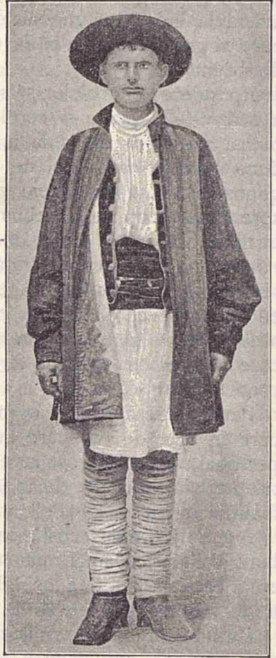
Un flăcău din jud. Roman.

Costumul acestui flăcău este: pălărie, mintean, cămașă, brâu, bernevice și botini.