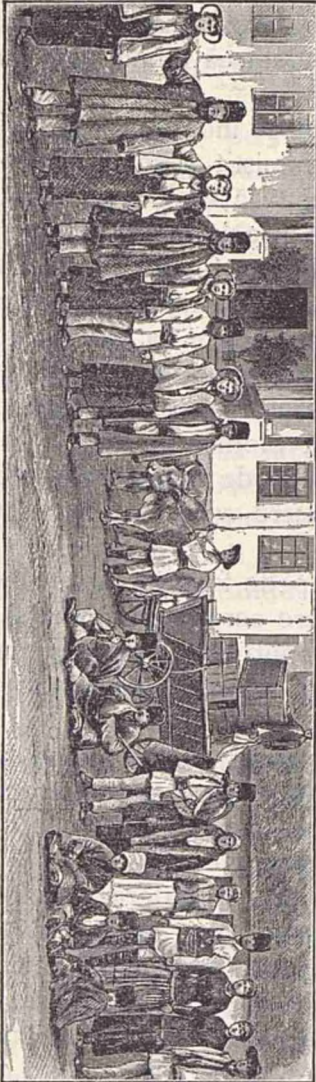
0 societate de petrecere în comuna Halănești (jud. Roman). La stânga Unguri. La dreapta Români.

Costumul acestui flăcău este: pălărie, mintean, cămașă, brâu, bernevice și botini.