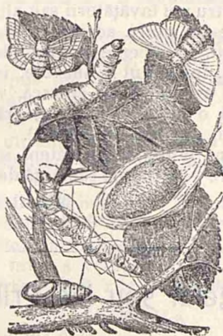
Gândacii de mătase.

—«Ba să mai zici fai», aprobau celelalte.