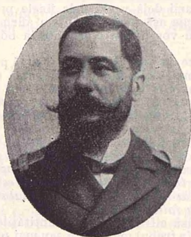
Colonelul Coandă, directorul serviciului maritim român.

Mai întâiu se inaugurează noul vapor «România», care va face curse între Constanța-Constantinopol-Smirna-Pireu . Acest vapor e cel mai mare, pe care-l avem noi pentru călătorii pe mare. El are o lungime de 112 metri și o lărgime de 12 m. 75. A costat 2.270.000 lei.