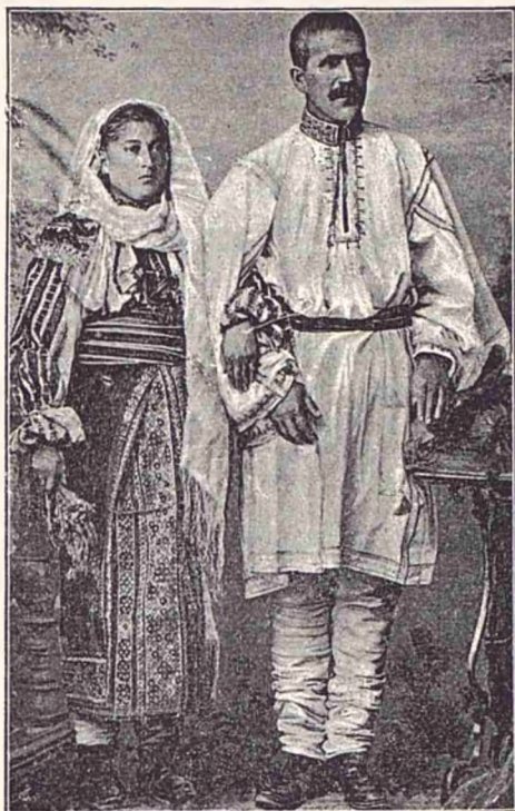
Costume din jud. Putna.