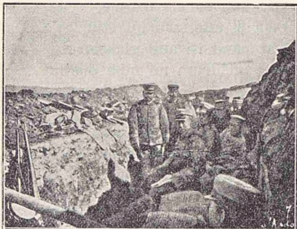
Japonezii într'o paralelă dinaintea Port-Arturului.