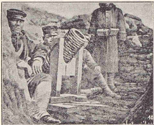
Japonezii aruncă bombe explozibile dintr'un tun de lemn, așezat într'o paralelă.