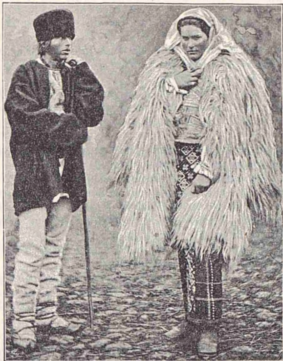
Costum din jud. Museel din părțile cele mai muntoase.