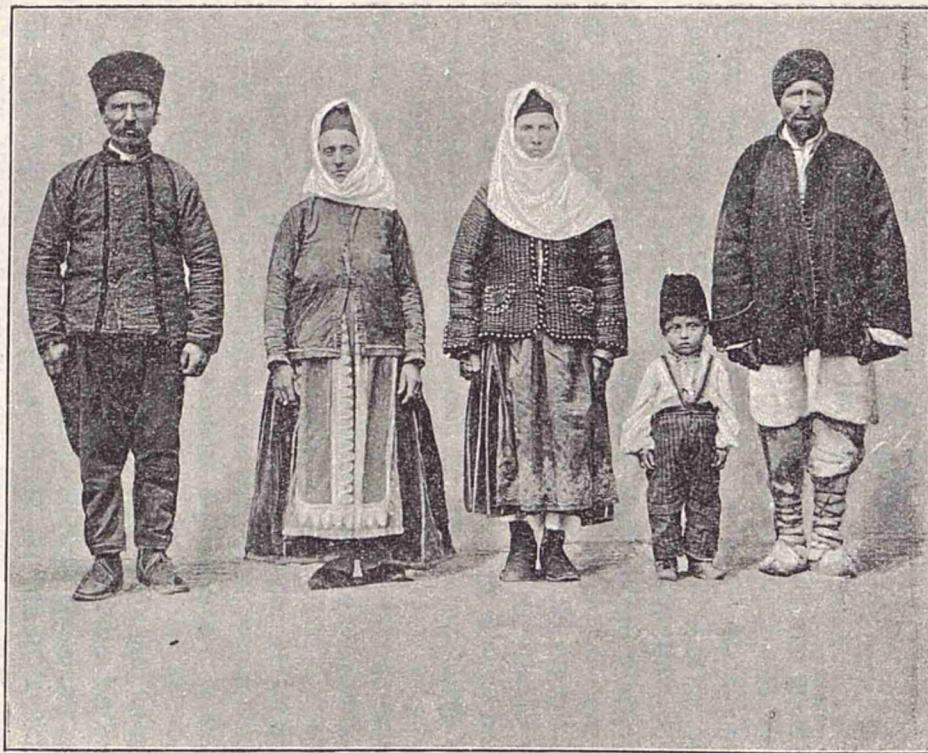
Costume din jrd. Brăila.