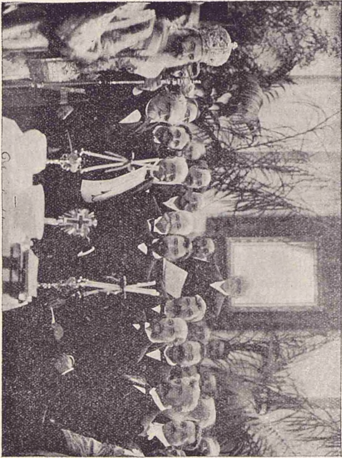
Deschiderea expoziției societății agrare din București în ziua de 27 Iunie 1901.

Kapokul este foarte ușor, poate pluti la suprafața apei chiar când s'ar atârna greutăți considerabile în raport cu cantitatea acestui bumbac. Astfel 200—300 grame Kapok poate ține la suprafața apei un om de o greutate de mijloc. La expoziția agrarienilor se vedea într'un vas mare de sticlă cu apă, plutind d'asupra un colac de Kapok, a cărui greutate nu era mai mare de 200—300 grame și de care atârna o măsură de 50 kilograme.