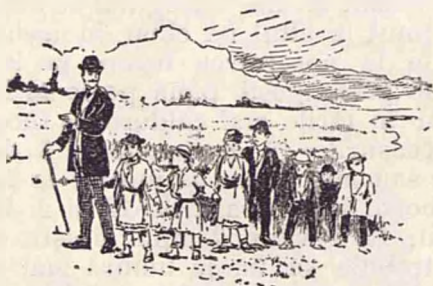
Copii în excursiune.

— Dar de ce oamenii caută să meargă pe unde e mai de-a dreptul?