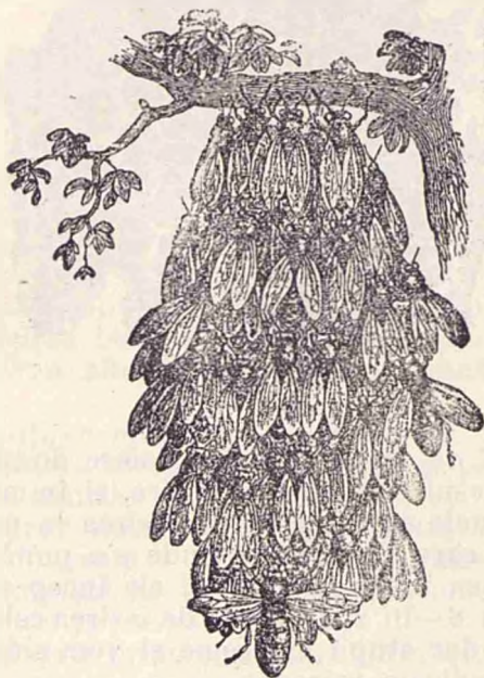
Roiul atârnat de cracă.

4) Felul stupului înrăurește cu deosebire asupra roirii, mai ales din pricina încăperii sale. Când o matcă rodnică umple fagurii cu mult puet, locul din stup devine prea mic și albinele se văd silite să plece. Albinele cari stau în stupi mari roiesc rar de tot. Astfel s'a dovedit că din 100 stupi, cu încăpere de 35—40 litri (două băncioare sau doi dubli decaltri) 60—70 dau roi. Din 100 stupi cu încăpere de 50—60 litri, numai 25—30 dau roi, pe când la stupii mai mari, numărul roilor se ridică abia la 5 la sută.