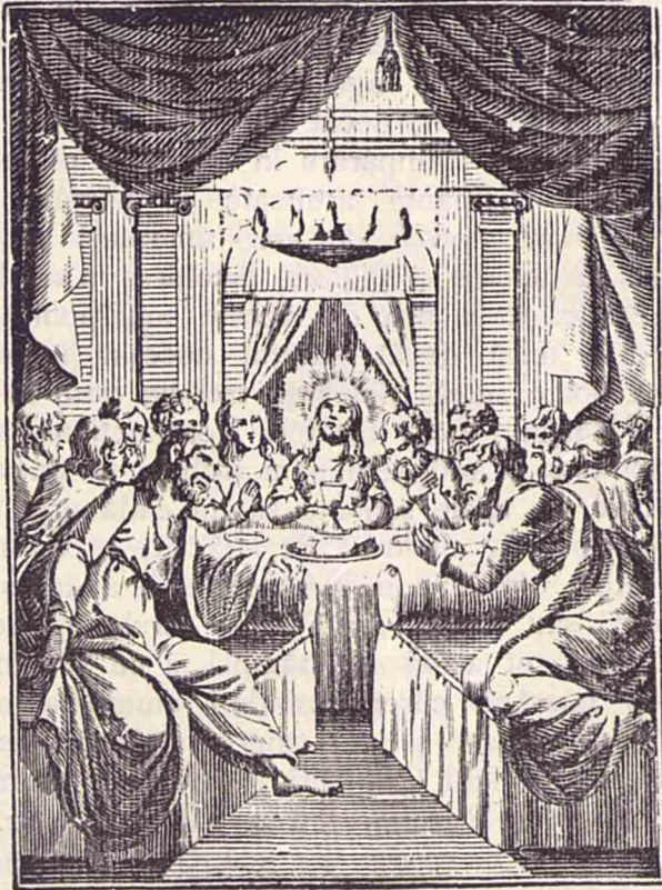
Cina cea de taină.