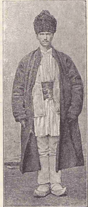
Costume din ud. Prahova (regiune muntoasă).