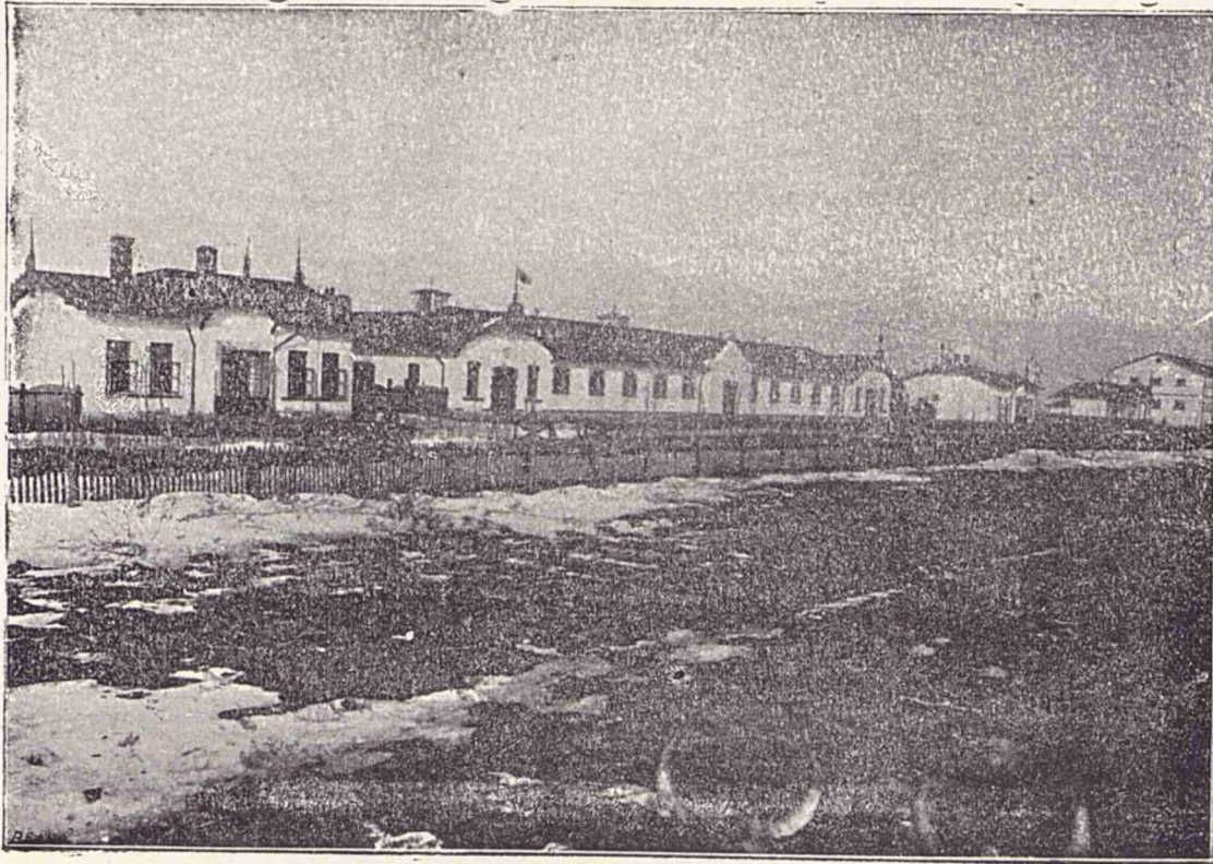
Veșterea Lăptăriei cu grajdurile pentru vaci dela Paris. Domeniul Coroanei Cocioc (Ilfov).