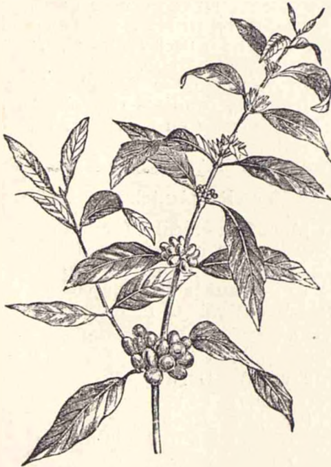
O ramurã de cafea.

12). Plante stimulante , sau excitante , în care intrã plante aromatice , balsamice , etc., (aceste tõte mãresc energia omulũ, îl excitã), cum sunt: anisonul, alãmãiul, ardeiu, bradul, cartoful, cafõua, cõiul, cõpa, cimbrul, cõda șoricelului, enu-