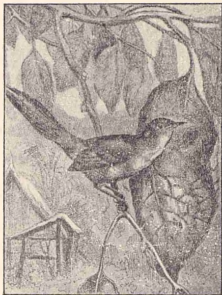
Cuib de cusătorésă.

muță s'ar urcă pe ea; altele din Africa pun spinii pe din afară, după cum oamenii pun bucăți de sticlă pe ziduri. Pe la tropice se văd și alte minunății; sunt paseri cari își împletesc cuibul, iar altele care-l cos. Cele d'întăiu își fabrică din nisce fire subțiri de plante o pânză cu care își învelesc cuibul, iar altele — cusătoresele — cos marginele unei