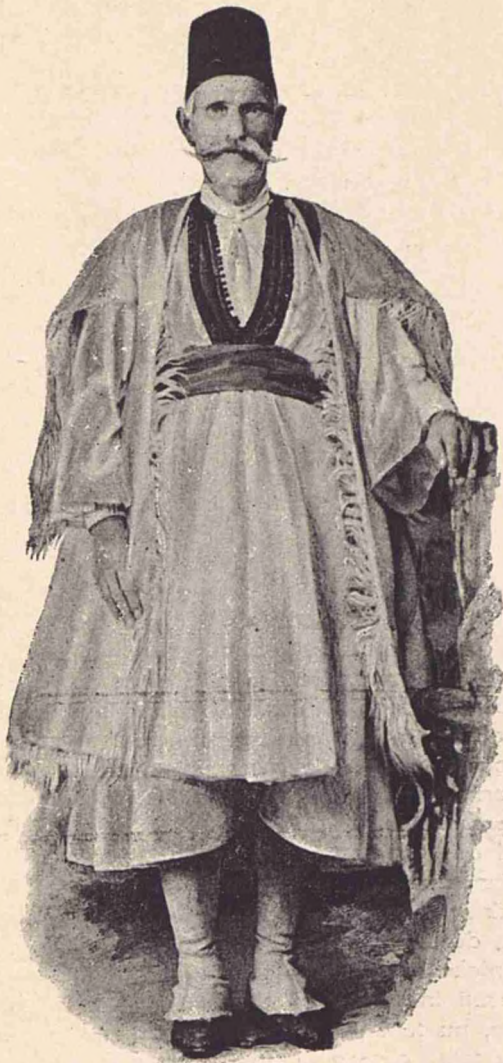
Un Celnic (Scuter).