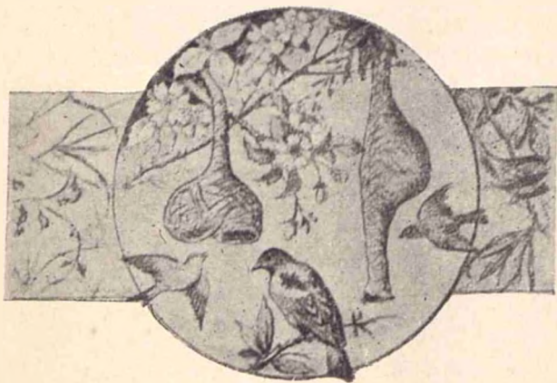
Cuib în formă de pungă.

Pasëriile nu numai că sciũ ce fel de material să întrebuințeze, dar sunt și dibaci arhitecți. Forma cuiburilor e schimbătoare, după pasëri. Rîndunelele și le fac în formă de buzunar și nu lasă decât o mică feréstră, pe unde să pótă ele intră; grangorul și-l légă de douë crenguțe ca pe un légân ce se clatină la cea mai mică adiere de vînt, iar un soiũ de pițigoï din Dobrogea, își face cuibul din puf de salcie, în forma unei pungì, la capëtul unei ramurì ce spânzură d'asupra apei. Prevëdătore sunt mai