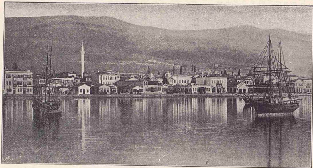
Orașul Salonic (Macedonia), văzut despre mare.