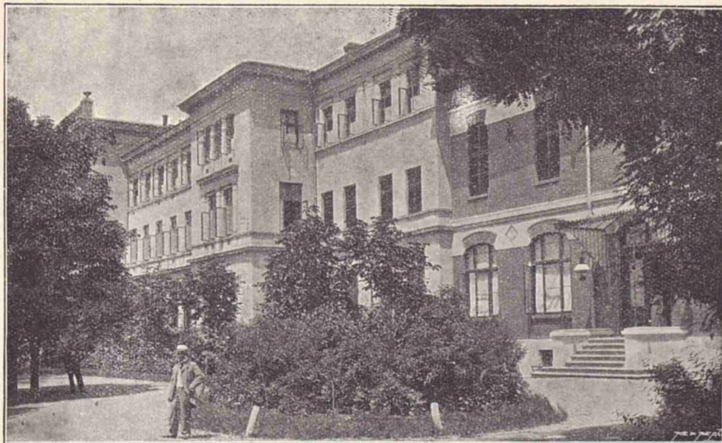
Asilul Elena Doamna, secția primară și profesională. (fațada principală).