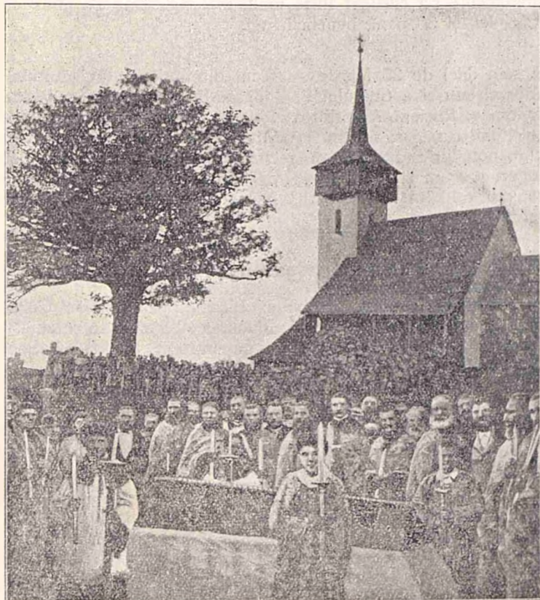
Inmormintarea lui Avram Iancu.

Se cere o garanție provisorie de lei 5% din suma devisului, iar cea definitivă va fi de 10% din suma rezultată la licitație.