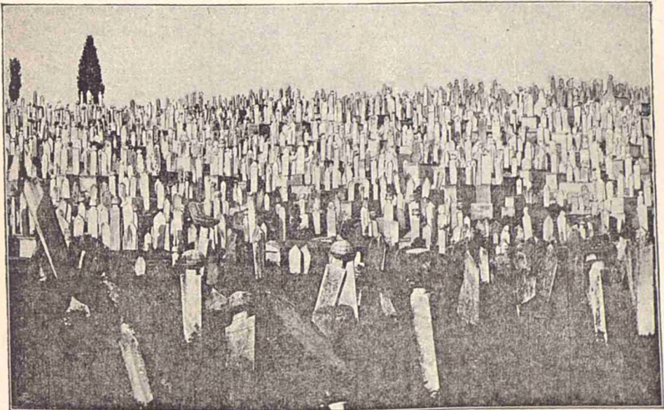
Cimitirul turcesc din Salonic. (In fund se v&ed doi chiparoși frumoși).