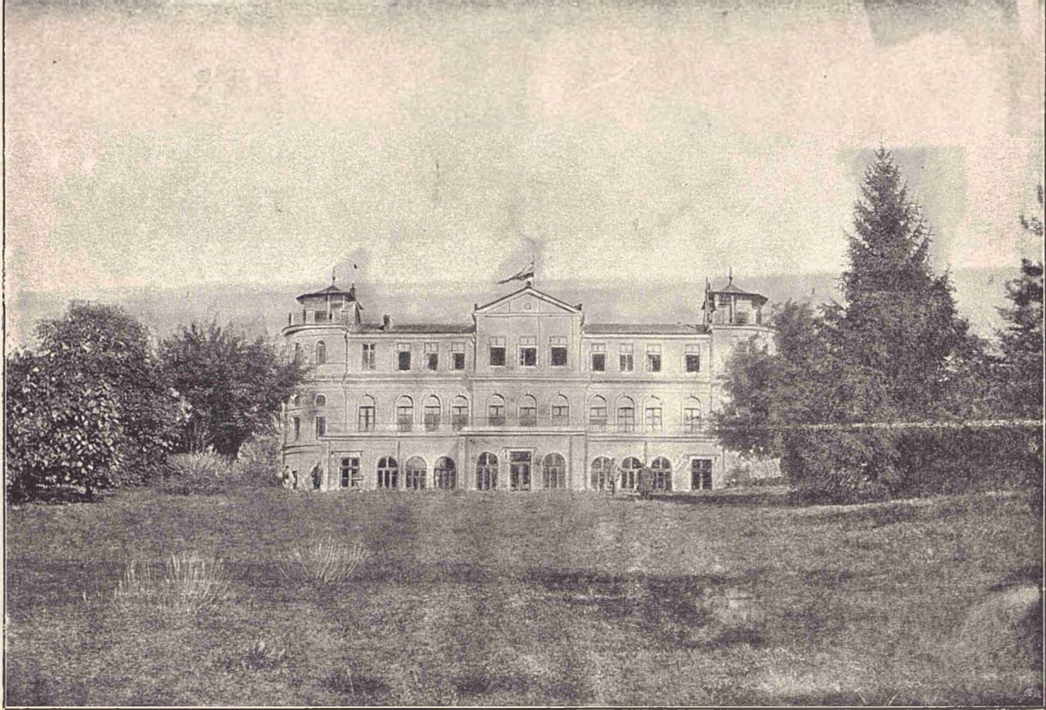
Institutul Ioan Otteteleşanu de la Măgurele. (Fațada despre parc).