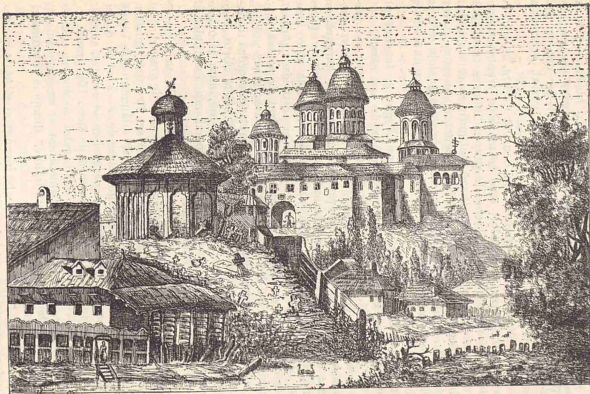
Monastirea Radu-Vodă din Eucuresci, înainte de restaurare.