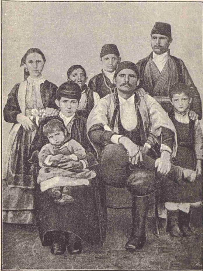
O familie de Aromâni.

Pentru moment să lăsăm sarica și să ne ocupăm de jocul cu sclavii, iar pentru altă-dată vom vorbi pe larg de îmbrăcarea togei aromâne cu tóte solemnitățile ei.