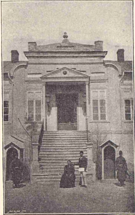
Intrarea principală a vechiului palat de la Cotroceni.