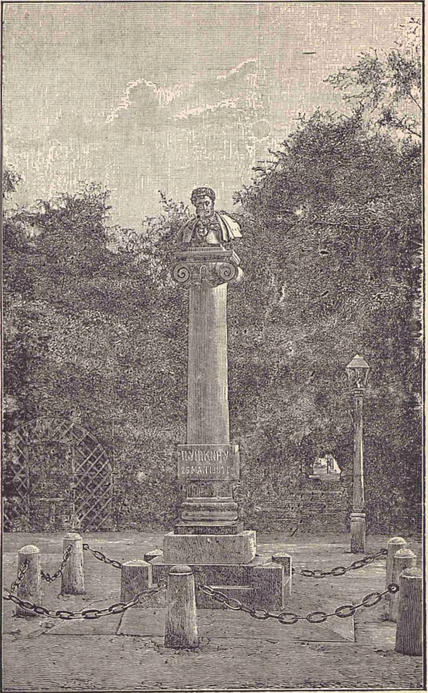
Monumentul lui Puşkin din grădina publică de la Chişineu.