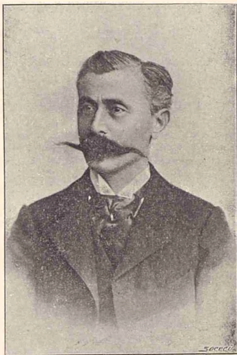
D-l Spiru Haret Ministrul Cultelor și Instrucțiunei publice.

D-lor, tóte ramurile învățămîntului public la noi au căpătat o dezvoltare mai mare decât cea necesară, după trebuințele țarei, afară de două: învățămîntul primar rural și învățămîntul profesional. În colo, învățămîntul secundar, cel primar urban și cel superior, ar pute, fără inconveniet, să fie restrânse la proporțiuni mai modeste, fără să înceteze de a răspunde la trebuințele țarei. (Aplause).