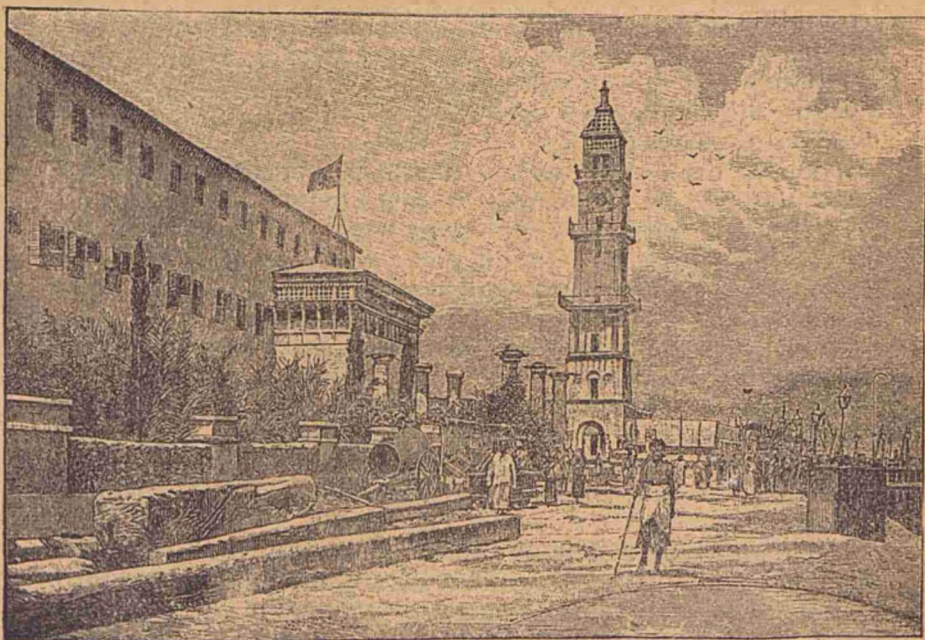
O stradă în orașul Zanzibar.