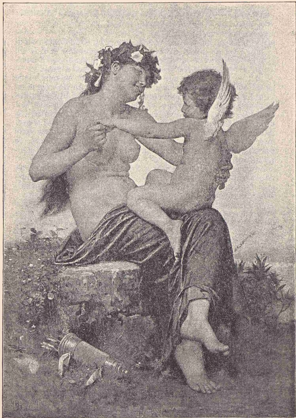
O Nimfă (Tablou).