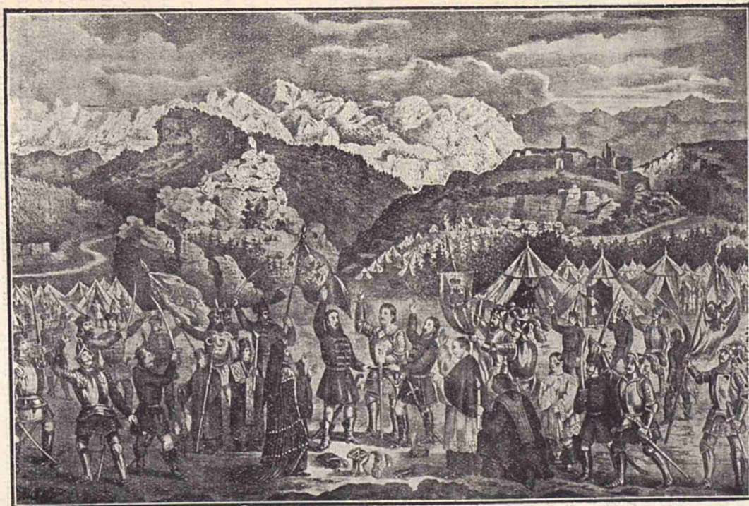
Jurămîntul de alianță al lui Mihaiu cu Sigismund Batori și Stefan Răsvan.