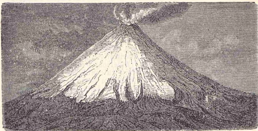
Un vulcan în erupțiune.

El e unit cu Port-de-France, cu un serviciu zilnic de vapóre și prin telegraf, singura linie telegrafică din Martinica, care are o lungime de 32 kilometri.