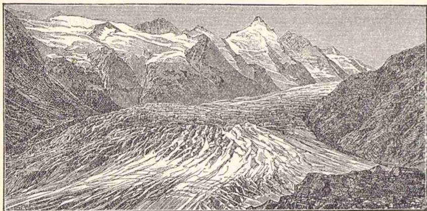
Un munte de construcție vulcanică.

Spre sfirșitul anului 1724, o inundație, urmare a ploilor din August, Septembrie și Octombrie, a acoperit întreaga insulă cu o masă de apă de o adâncime de zece picioare și produse pagube incalculabile.