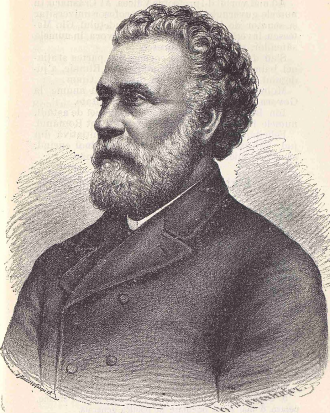
Ión C. Brătianu.