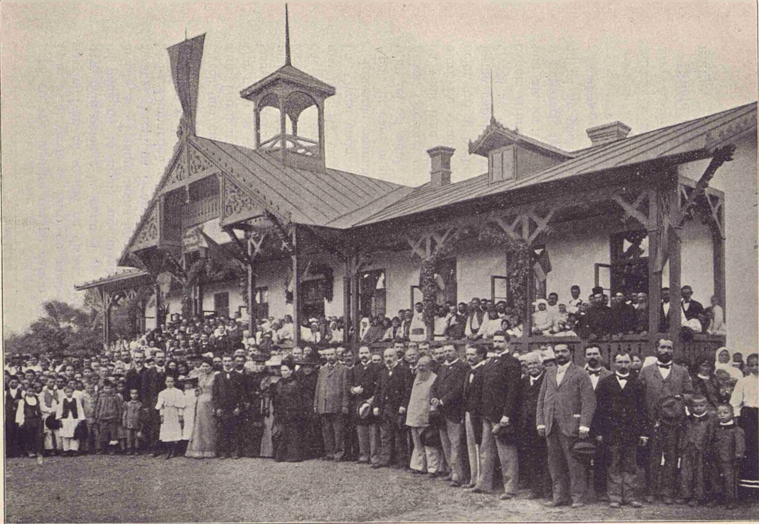
Inaugurarea școlii din cătușul Sudiții de pe Domeniul Corónei Șerghița (Prahova).