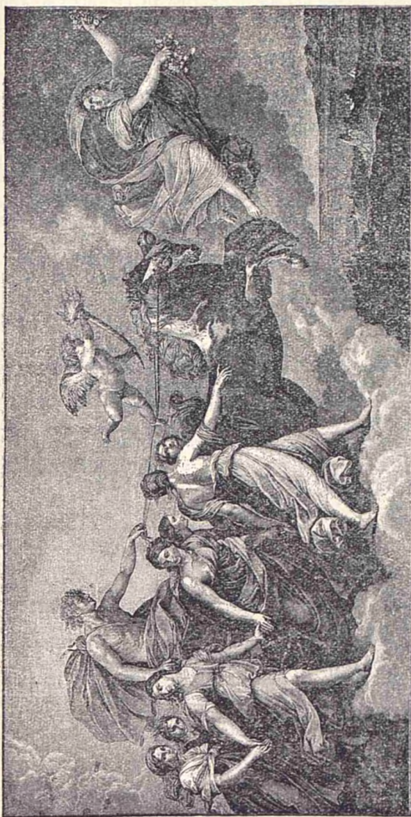
Apoline (Sórele), precedat de auroră și însoțit de cortegiul său divin cureeră spațiul spre a răspândi lumina, după credința mitologică a Grecilor și a Romanilor.

5. Buddhismul: răspândit mai cu seamă în Indochina și în archi-