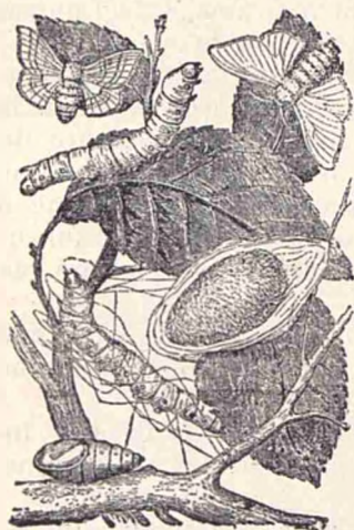
Viermi de mătase.

Acastă etate incepe de la învierea viermilor de mătase (larvei) din ouele lor, și ține cinci zile, pînă cînd viermii încep să devie berci și să-și schimbe pentru prima oară pielea. Indată ce au început să iasă din ou, trebuie să le dăm hrana necesară și anume frunze de dud. Inșă acestea nu li se dau întregi, fiind-că fălcile viermilor nu sînt așa de puternice, ca să le pôtă mîncă și din acastă cauză sînt mulți viermuși, cari mor de fîme mai cu sémă la început. E bine ca frunzele să le tocăm cu