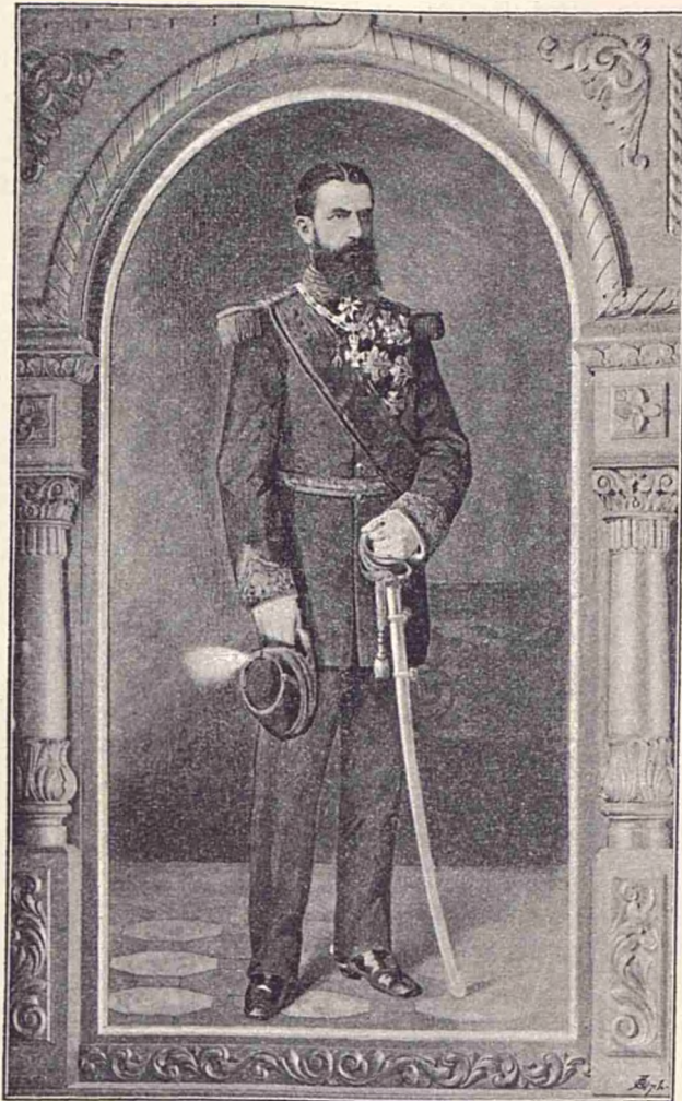
M. S. Regele Carol I.

«Și la inimă îmi morse când Măria-Sa grăi De-al de noi, de noi Țărații, ca părinte cu'ndurare: «Cele bune, cu încetul se pot bine făptui; «Gândul Meu la voi îmi este să vă ved în bună stare.