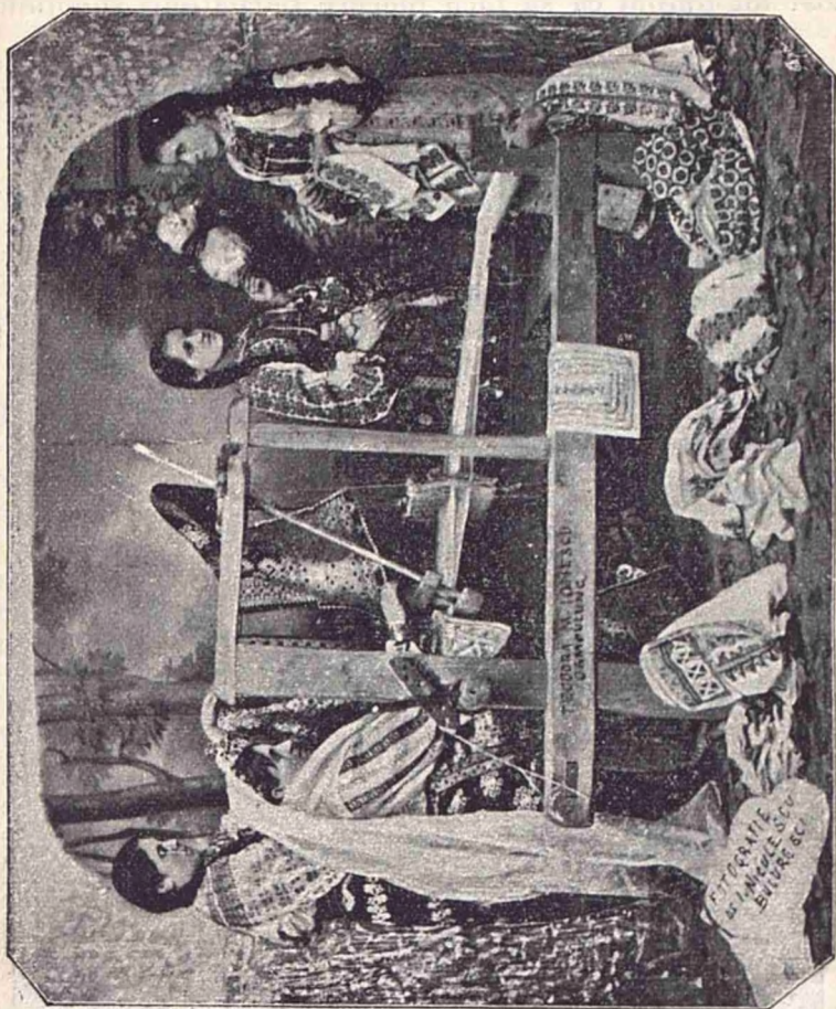
Terance țesend la rășboi.

cele române abătându-se de la obiceiul străbun se fac` de rîs și glumă prin rochiile și pălăriile străine și pe cari nici nu le sciū îmbracă nici conservă. Vădend asemenea țărance, fără voe ne vine în minte fabula, când cióra încercă să se