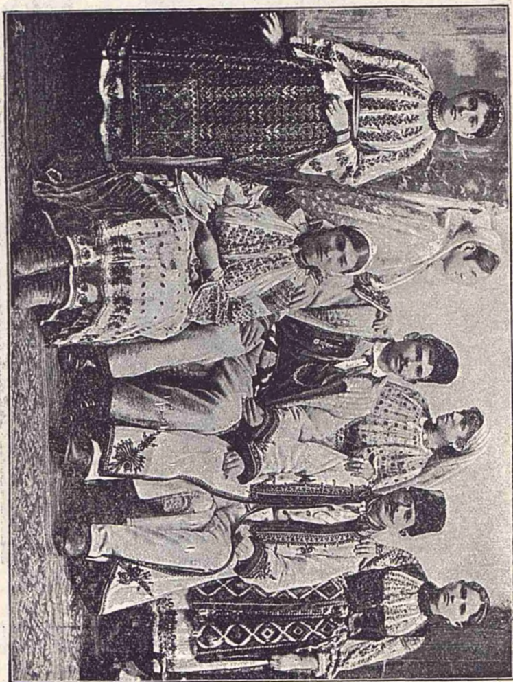
Port țărănesc din regiunea șesului oltenesc.

prin munca și sirguința lor. Asemenea muere casnică priveghiază ca un înger păzitor asupra familiei, ca fie-care să pôtă fi îndestulat. Mai mult, îmbărbătează la muncă și sirguință pe toți ai săi.