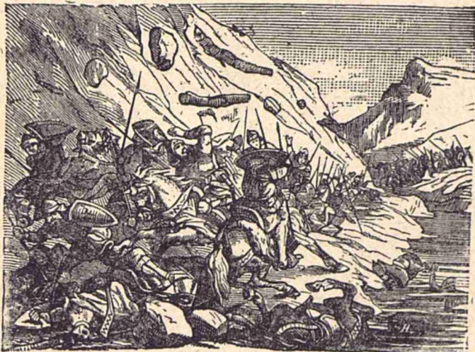
Infrîngerea lui Carol Robert.

Robert. Pe vremea aceea principii noștri aveau legătură de supunere față cu regeii ungurești. Se vede că Basarabul nostru a cam cercat să scape de aceste îndatoriri. Acesta a stîrnit furia regelui unguresc. Și iată-l pe Carol Robert intrând pe la Orșova în țara românească și înaintînd pînă la Olt. Domnitorul, nesimțindu-se în stare să se împotrivască cu oștea, a încheiat pace; dar acest lucru n'a plăcut norodului, care s'a hotărît să-și răsbune.