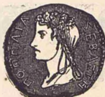
Poppea Soția lui Nero