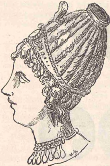
Coafură numită corymbium