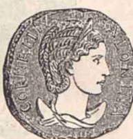
Cornelia Salonina Soția lui Galian