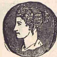
Iulia Soția lui Titus