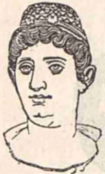
Faustina cea tinără.

S oefii latini ca Ovidiu, Propertiu, Tibul, Marțial, Gallu, etc. ne dovedesc ce preț mare se puneă pe îngrijirea părului la Roma, căci vorbesc foarte pe larg de acest subiect, adică descriu numeroase coafuri, mai cu seamă la femei, îngrijirea lor, podóbele ce li se adăogau și parfumurile ce se întrebunțau. Acești amici ai Muselor ne ini-