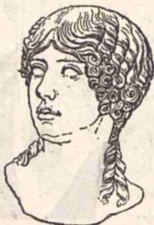
Coafură de la începutul secolului I după Christos