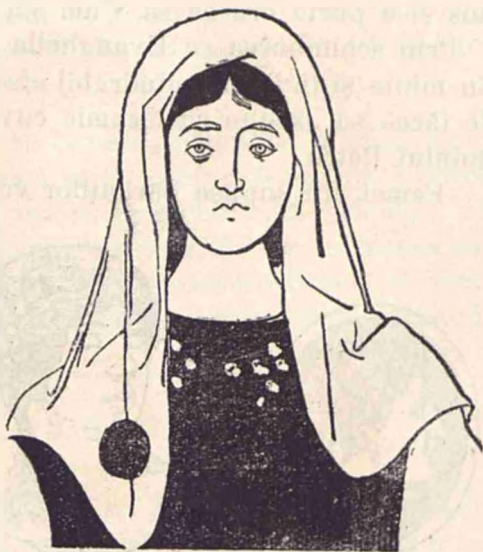
Matronă creștină din primele timpuri ale creștinismului.

Trebue să recunoscem că aceste nimicuri, aceste lucruri ușurele, acea căutare a voluptății, și acea furie de plăceri a lumei romane, a scăzut cu încetul sub influența creștinismului. In locul acelor femei, cari își împodobesc pe întrecute mândria cu diamante falnice, vecinic înfundate în ospețe și orgii, vin acum și femeii acoperite cu vëluri pudice cu stofe cu culori închise, la cari nu se vëd de cât descență și simplitate. In locul acelor patriciane barbare, cari pedepsesc nedibăciile sclavelor lor, înfigându-le un ac în sân, sînt acum și femeii, cari numesc surorii pe servele lor, și împreună sînt umi-