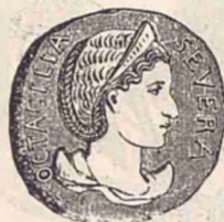
Octacilla Soția lui Filip