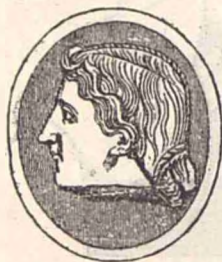
Livia, soția lui August.

«Femei, fiți supuse bărbaților voștri! podoba voastră să nu