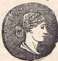
Iulia Fiica lui August