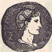
Faustina Soția lui Marcu- Aureliu