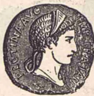
Plotina Soția lui Traian