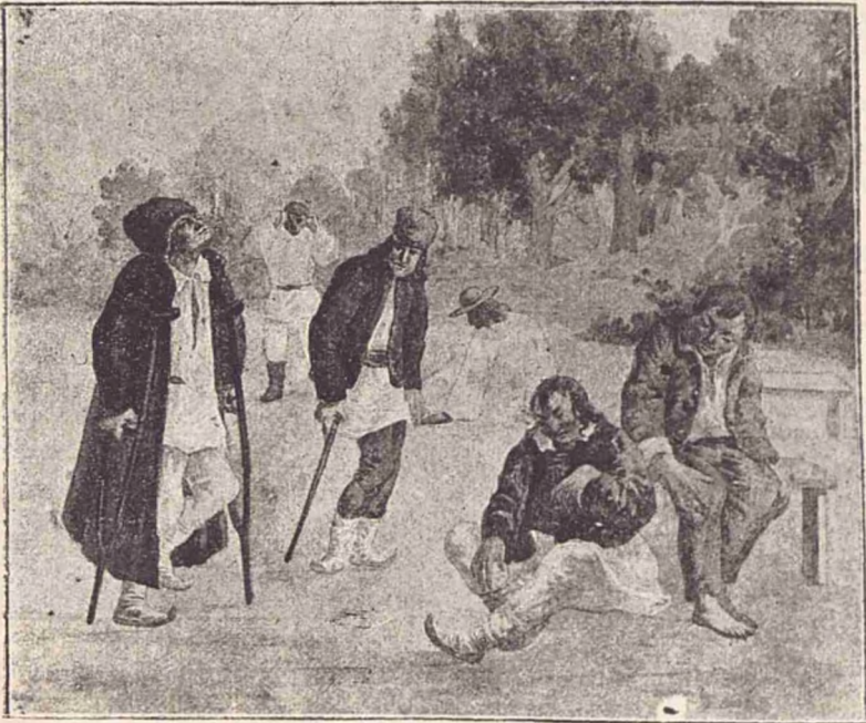
Bețivii ajung damblagii.

În curînd asasinul a fost judecat de către Curtea cu jurați. Procurorul în cuvîntarea sa a arătat în totă goliciumea sa viață păcătösă a criminalului,