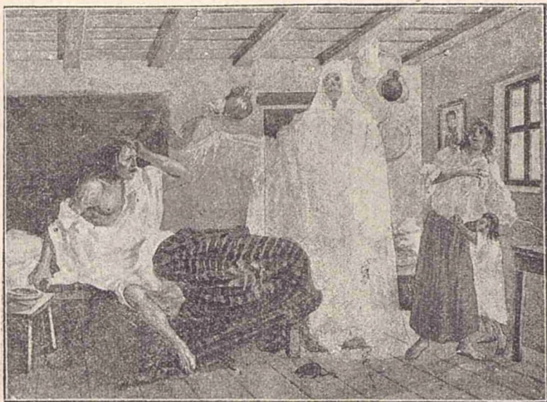
Bejivul are vedenii îngrozitoare.

Grósnică a fost și mörtea omului. Inainte de a-și da sufletul, nenorocitul a fost sbuciumat de tot felul de vedenii. Cu vocea plină de gróză, dînsul rugă pe femeia sa ca să alunge din casă o sumedenie de