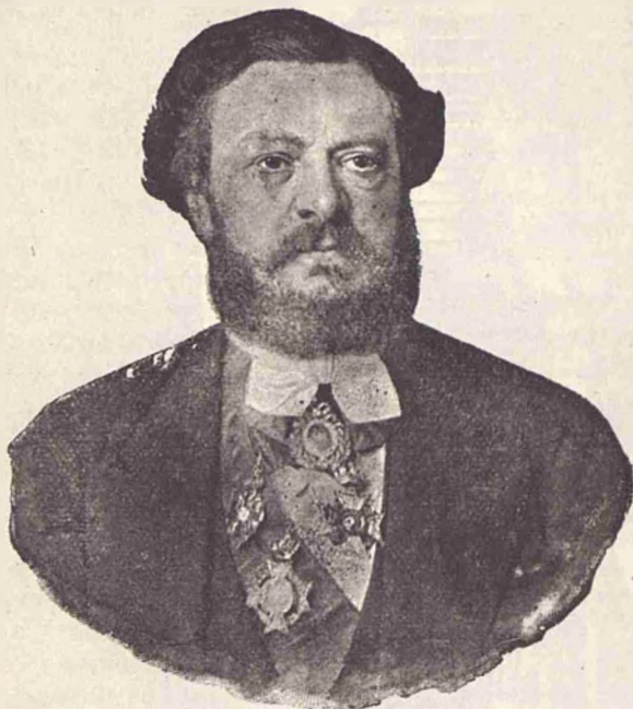
Principele Dimitrie Ghica.