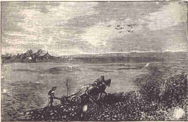
Priveliște de August: la arat.