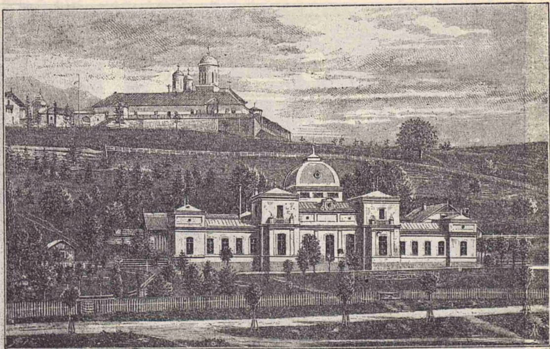
Stabilimentul hidroterapeutic din Sinaia.