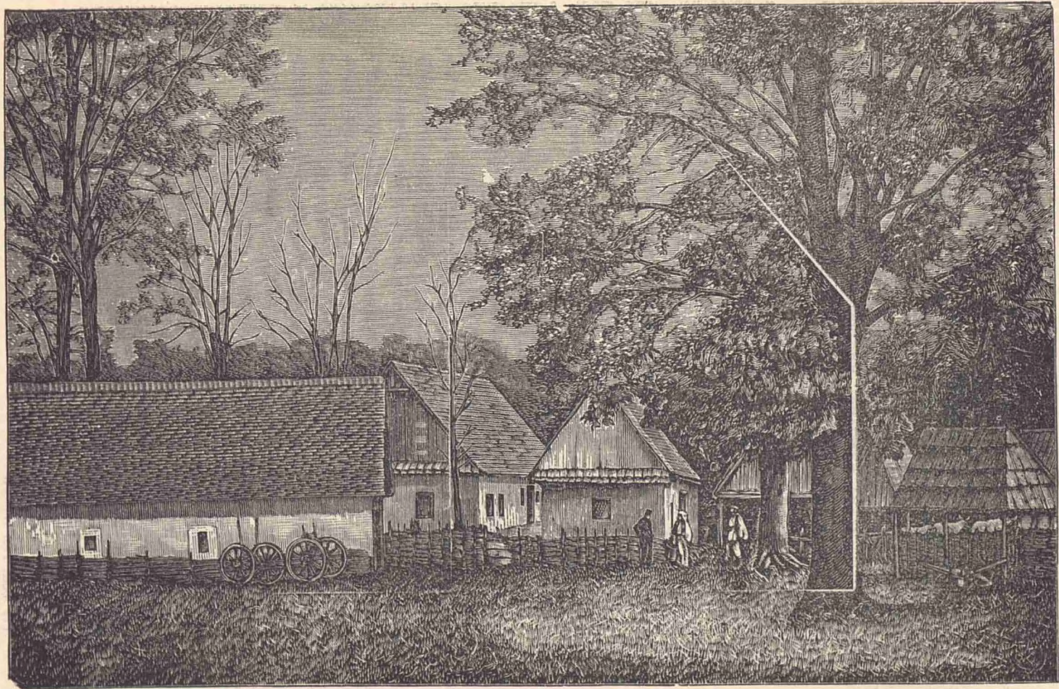
Gospodărie sătăscă din Bosnia.