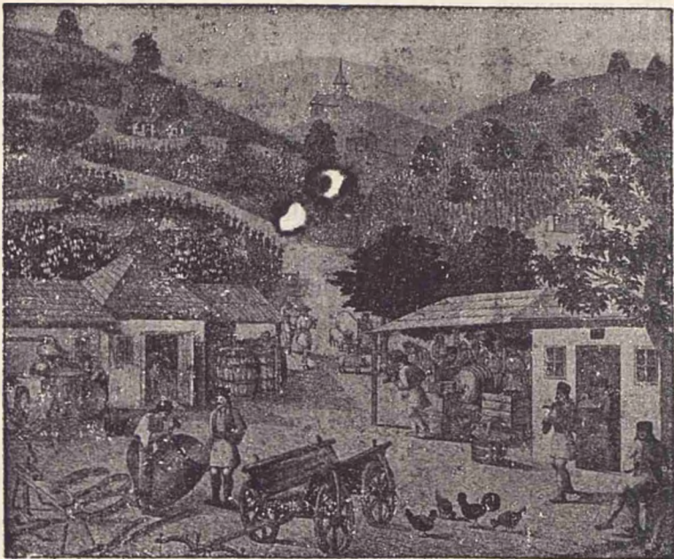
Cum se face vinul.

La noi în țarã, în unele localitãți, culesul viilor începe de pe la 15 Septembrie stil v.; iar în alte localitãți și mai târziu. Strugurii se culeg cãnd s'a ridicat roua de pe ei. Cãnd plouã sau cãnd plóia