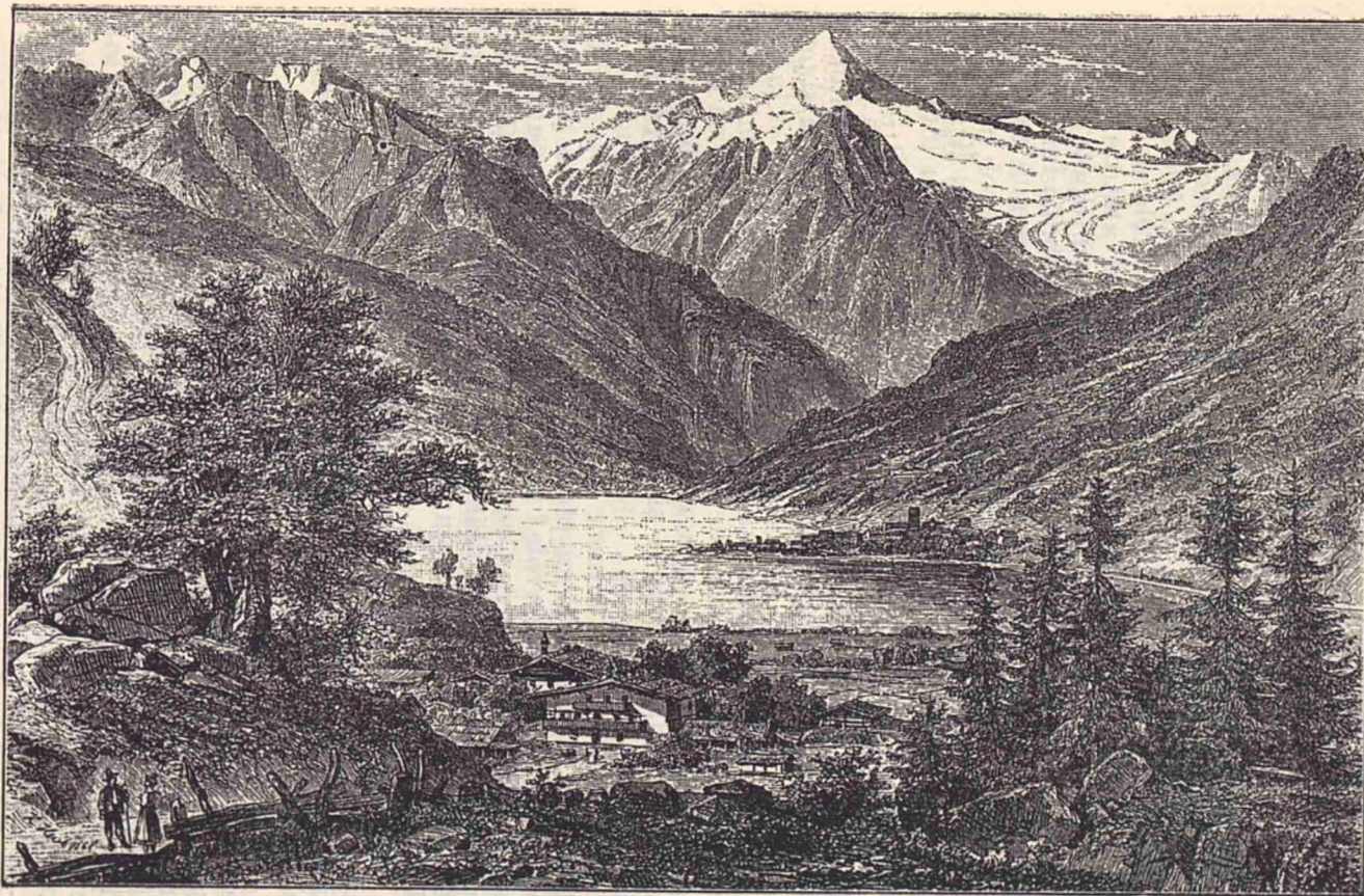
Vedere din Elveția.