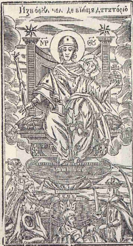
Zugrăvelă dintr'o veche biserică.