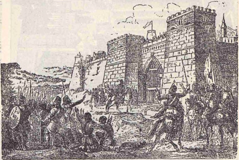
Ștefan la Cetatea Némțului.

Ce bogată de exemple frumoșe este viața lui! Cu o mică ôste stă în potriva oștilor Turcului și ține cu cinste stégul țării sale. Evlavios, el zidesce mânăstiri după fie-ce isbindă. Când sórta îi e protivnică și numărul dușmanilor îl covir-