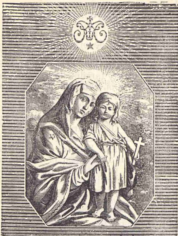
Maica Domnului cu Pruncul.