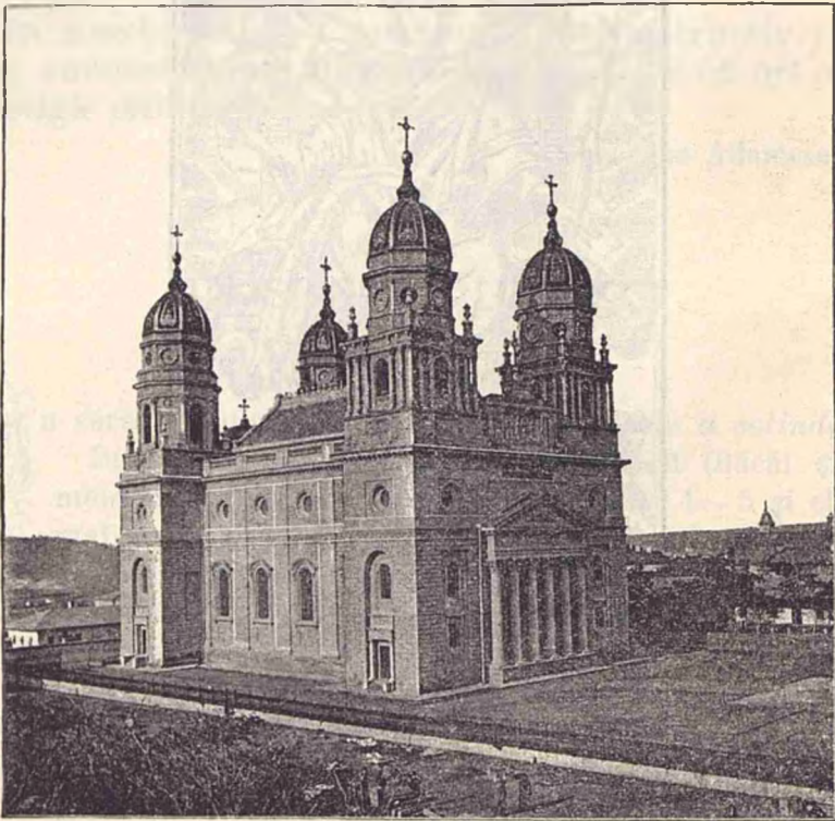
Mitropolia din Iași.

S un adevăr netăgăduit că în țara noastră suferim de păcatul centralisării; vrem să avem în București tot ce e mai bun; cu toate acestea dintr'un punct de vedere trebuie să facem o excepțiune pentru orașul Iași. Toate guvernele au cheltuit sume enorme pentru construcțiuni mărețe, cari întrec fără îndoială pe cele din București. De