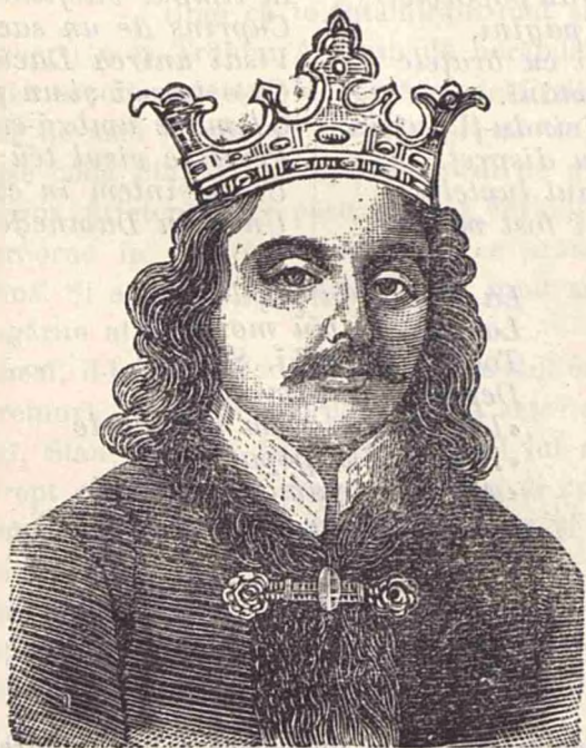
Ștefan cel Mare.

În amintirea acelor timpuri, dăm aci, odată cu chipul eroului, și poesia lui Alexandri în care se glorifică faptele lui Ștefan.