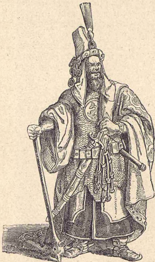
Atila, biciul lui Dumnezeu.

S'au desfăcut în părți, unii voind să aibă rege pe cutare, alții pe cutare. Când i-au vădut slabi și debinați, popoarele supuse s'au ridicat unul câte unul și s'au scăpat de jugul Hunilor; apoi au început să-i lovească și să-i gonască spre Răsărit spre Maa-