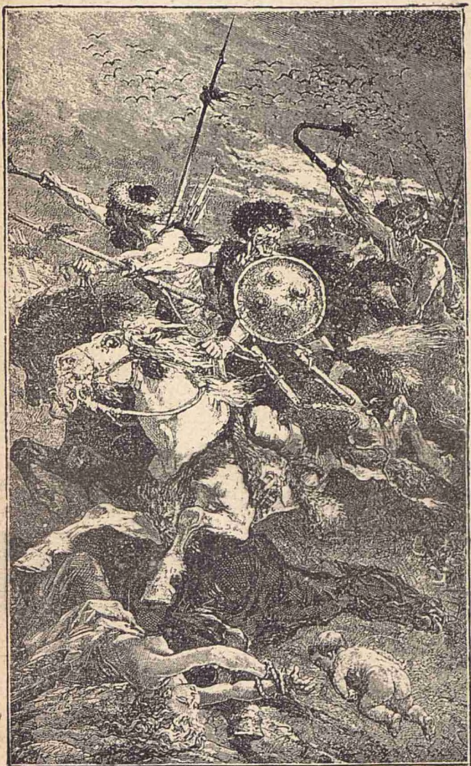
Hunii la năvală.