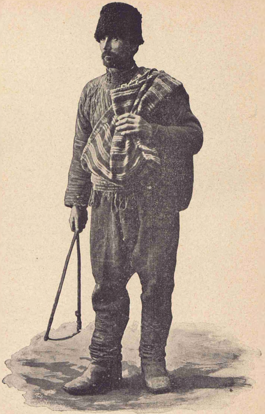
Tip de Român din Basarabia.