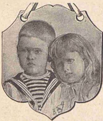
AA. LL. RR. Principii Carol și Elisabeta.

Din parte-ne facem cele mai căldurose urări pentru o grabnică însănătoșire și unim glasul nostru cu al miliónelor de Români spre a ruga pe Cel