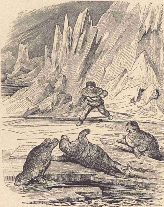
Eschimos la vĂnĂtore.

Eschimoșii locuiesc Ăn nisce covergi, sau mai bine dicĂnd Ăn nisce vizuini, fĂcute din zĂpadĂ; ĂnĂuntru paturile sĂnt așternute cu blĂni de urși și de vulpi, cum și cu piei de rațe și de alte pĂsĂri. — Mobilierul unei familii se compune