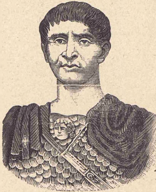
Traian, cuceritorul Daciei.