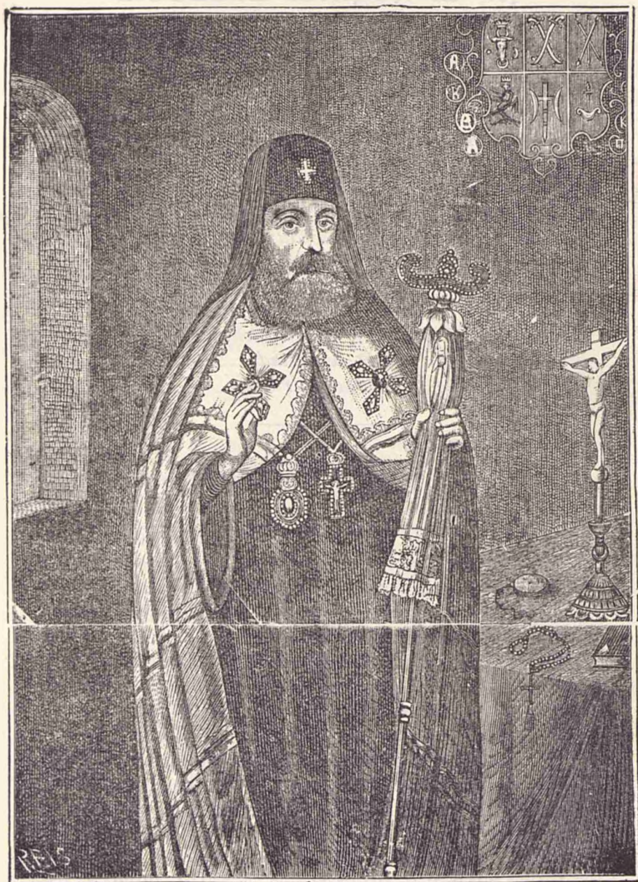
Petru Movilă, Mitropolitul Țievului.