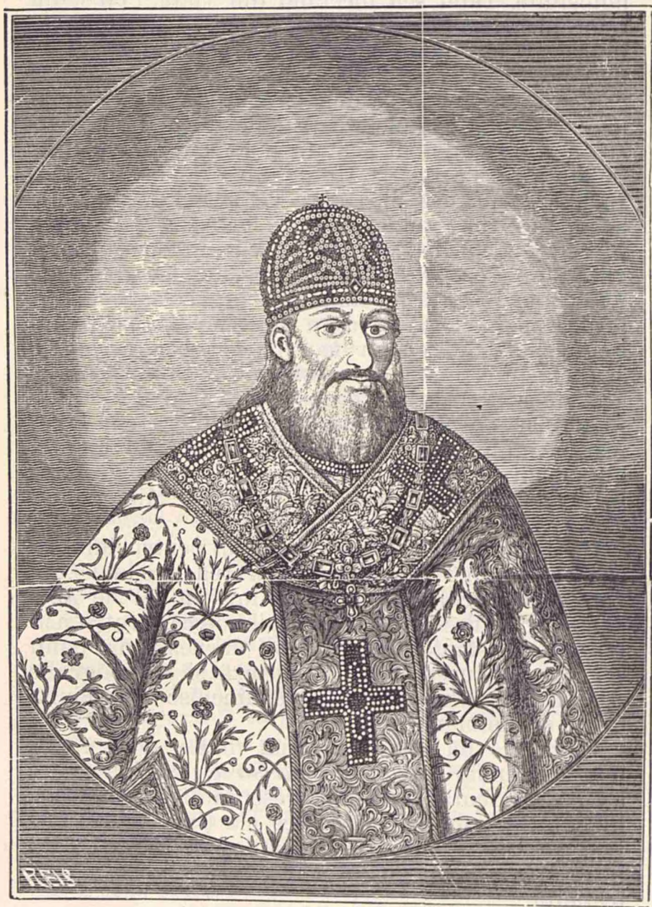
Petru Movilă, Mitropolitul Țievului.