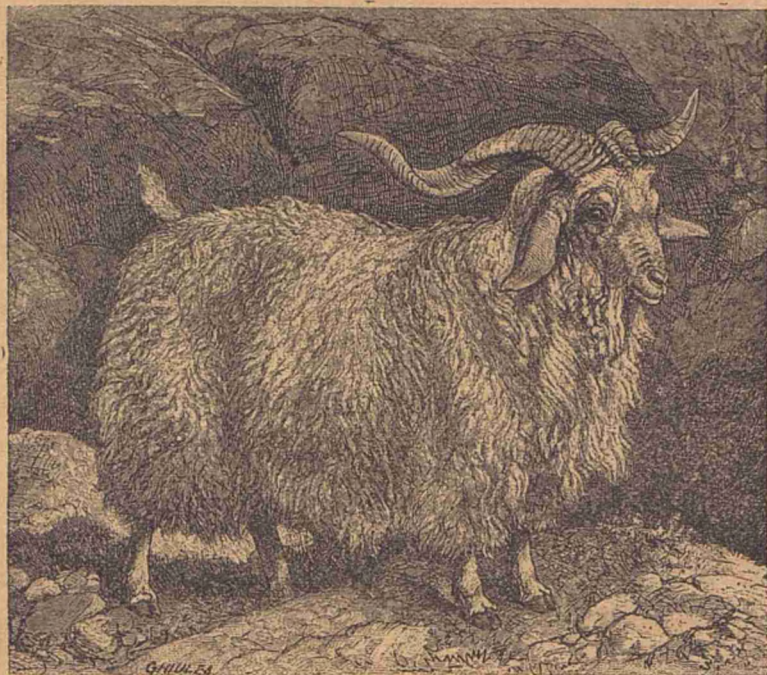
Capra de Angora.