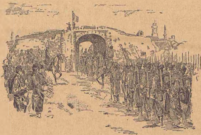
Intrarea Românilor în Vidin.