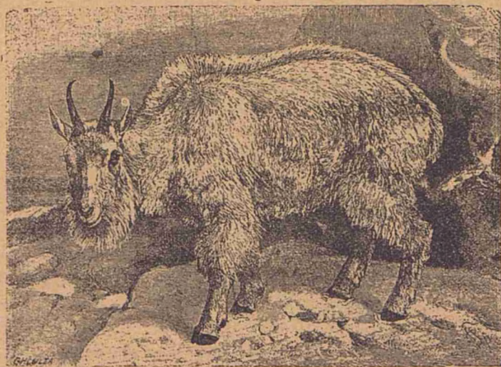
Capra din Munții stîncoși.