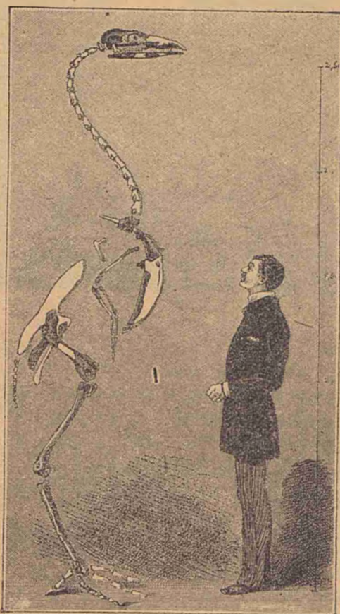
Scheletul unei paseri uriașe.