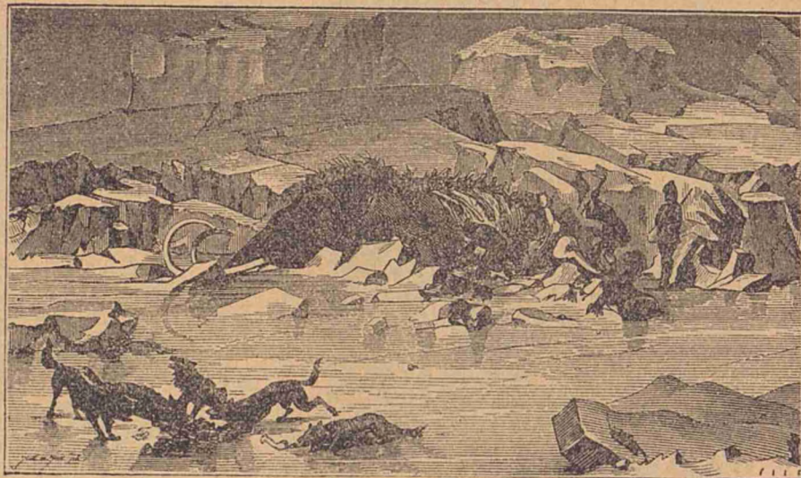
Mamut găsit în ghețurile de la gura râului Obi.