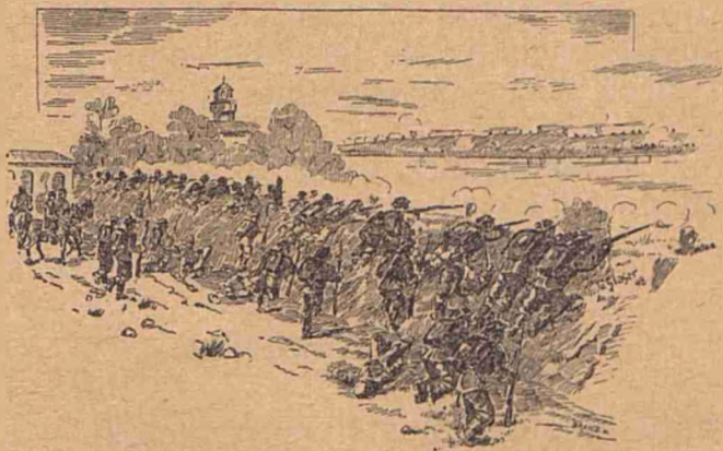
O lupt  peste Dun re.