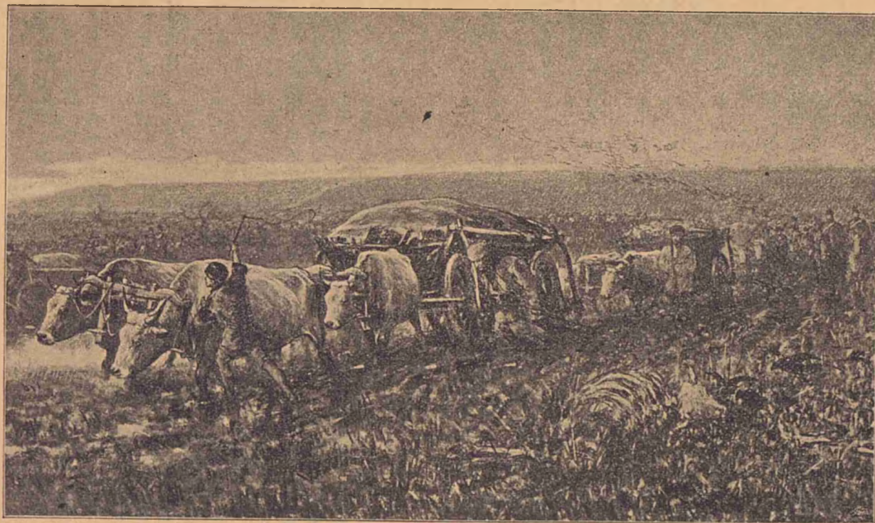
Pe drumul Plevnei: Un convoi de munițiuni.