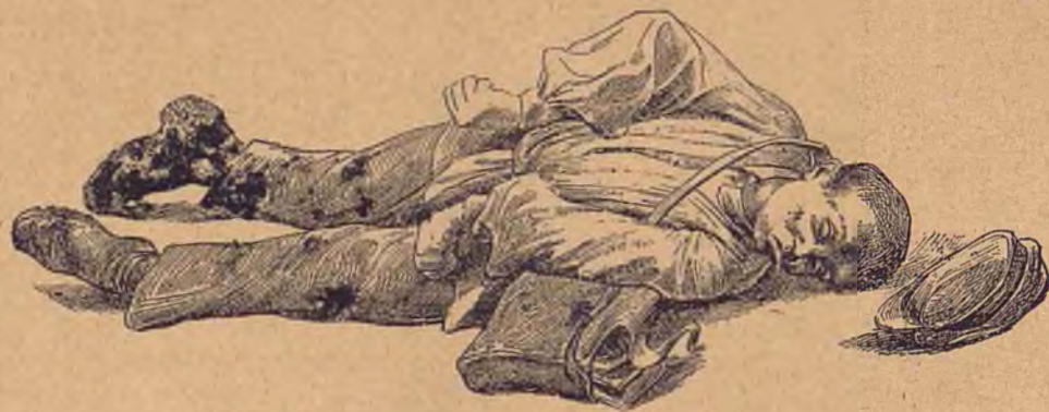
Copil de bețiv lovit de bôla copiilor.