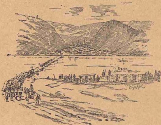
Nicopole și podul peste Dunăre.

Pîn'a fost vreme bună, Domnitorul cu suita Sa, vr'o patru-șeci de oficeri, mâncau în curte. Când ploua, mâncau cu toții în tindă, pe rînd, căci abia încăpeau câte șase la masă. Iar mesele lor nu erau mese de Domn, nici măcar de om cu dare de mână. Mâncau din mîncarea soldaților, ciorbă și rasol, și câte odată friptură de berbec. Ouă, unt, zarzavat și altele erau aduse în fie-care și din Turnu-Măgurele, cale de 50 de kilometri. Vorba vine, că erau aduse; într'adevăr nu le vedeau cu ochii câte 3—4 zile, iar după ce au dat ploile și zăpada cu viscol, nu le-au mai văduț cu săptămânile.