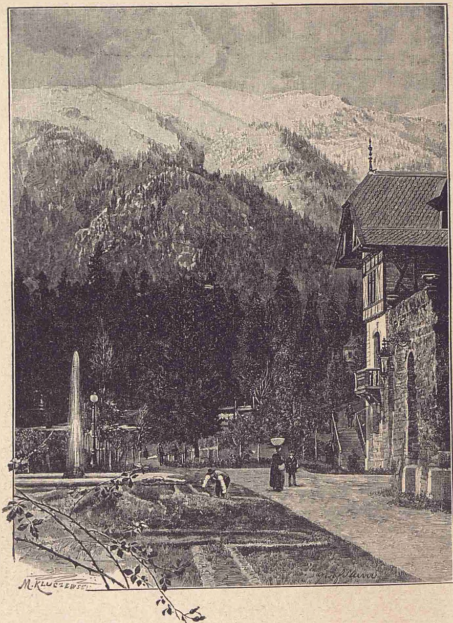
Vedere din Sinaia.