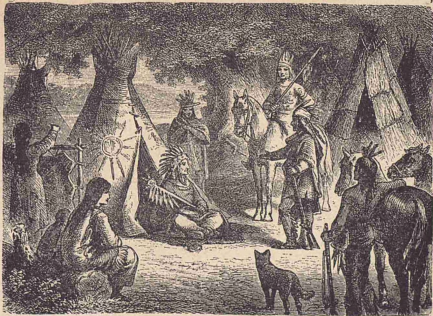
Sălbaticī din America.