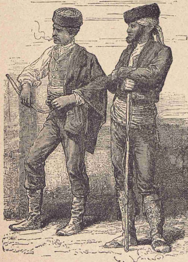
Tipuri de Spaniolii.