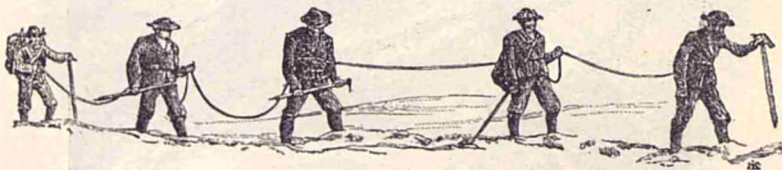
Fig. 4. Escursionisti, trecēnd un ghețar, se țin lanț printr'o fringhie.

Ca să pōtă luptă cu greutățile ce aū de învins, escursionistii trebuie să se încalțe cu cisme sau ghete cu tălpi grōse, țintuite cu colți de fier, pentru a nu alunecă pe ghiață sau pe piatră; să se înarmeze fie-care cu cāte un piolet, un fel de toporaș terminat printr'un vîrf ascuțit la un capēt și cu o limbă de teslă la celăl-alt, acest toporaș este purtat de o cōdă de lemn lungă de 1 m ,20—1 m ,50; iar la celăl-alt capēt al cōdei se află un vîrf de fier ascuțit; acest piolet este absolut necesar și servește pentru a se propti în el, a se agăță și a scobi în ghiață sau piatră pentru a face trepte ca să pōtă pune piciorul, pentru a înaintă.