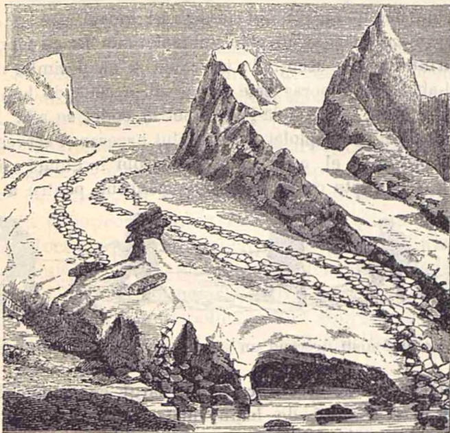
Fig. 4. Ghețar cu morene și cu blocuri eratice.

2. Pe lîngă bolovanii de stînci rupti de cîtore ghețar însuși, nenumăratele pîetróte, ce cad din vîrfurile munților, desgrădi-