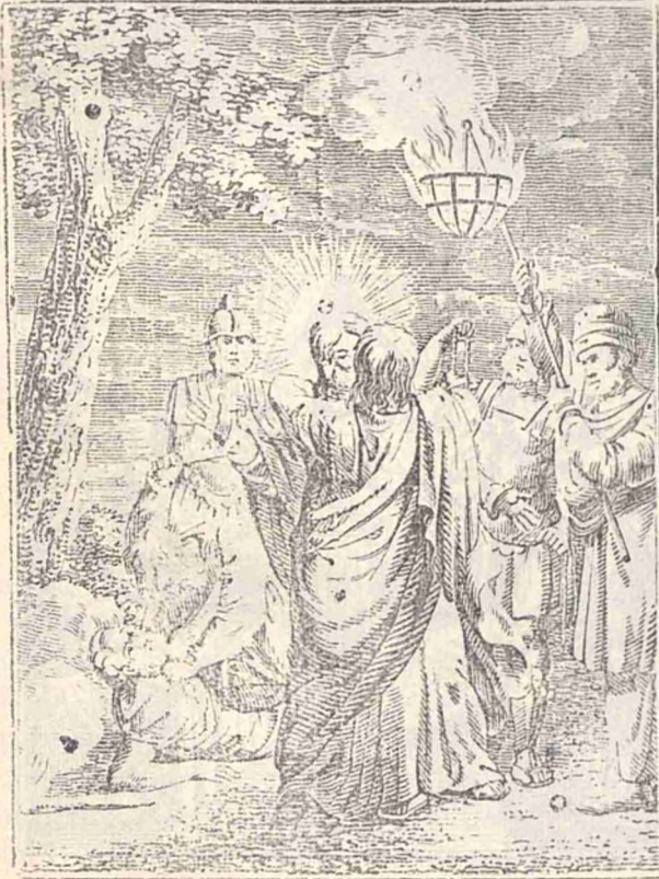
Sărutarea lui Iuda.

cea de bună voe». Inainte de a se pune la masă joi sêra Isus încinge o totă și spală picîorele ucenicilor sêi, în semn de smerenie: «Cunosceți ce am făcut vouă? Voi mă numiți pre mine Învățator și Domn, și bine diceți că sînt. Deci dacã Eû Domn și Învățator am spălat picîorele vîstre, și voi datori sînteți unul altuia să spălați picîorele, că pildă