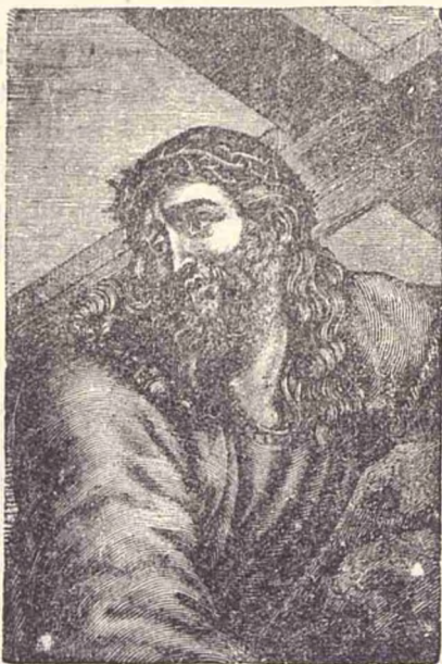
Christos ducând crucea.

Dar inimiții lui creșterând că Isus nu va ajunge viu la locul de pierdere, și așa că nu-și vor putea îndestulă mânia de tortură asupra lui, au silit pe un om anume Simion Chirineul ca să ducă crucea Mântuitorului Isus pînă sus în muntele Golgota.