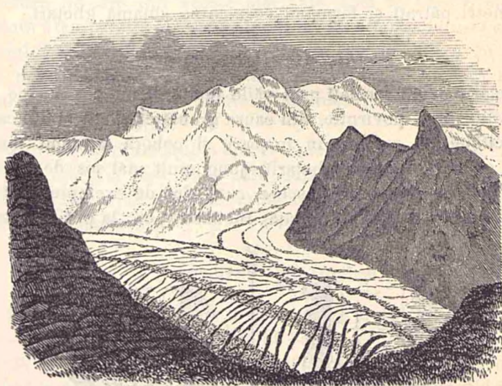
Fig. 2. Crăpături în masa ghețarului.

Pentru măsurarea iutelei de mișcare a ghețarului și a felului cum ea se face, iată în ce chip s'a procedat: de la o margine la alta A B, a unui ghețar fig. 1, s'au înșipt mai multe sulii în linie dreaptă arătate prin semnele cu No. 1, 2, 3, 4 și 5 (săgéta arată direcția mișcării ghețarului); după un timp óre-care toate semnele au înaintat, însă cele de la margini mai încet, iar cele din mijloc mai repede, așa că nu se mai găsesc în linie dreaptă, ci formeză o linie curbă.