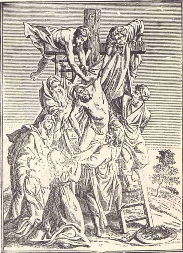
Pogorirea de pe cruce.