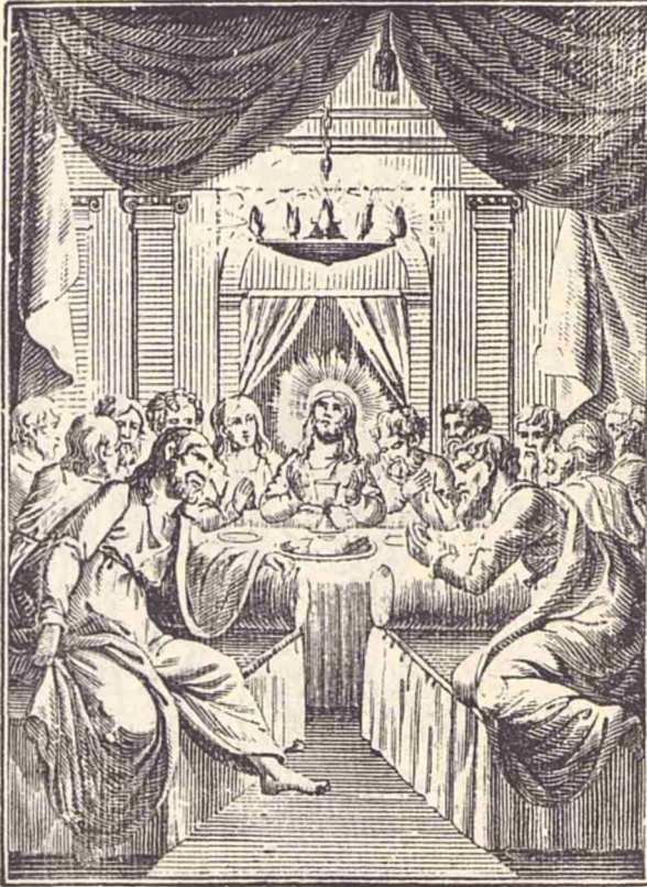
Cina cea de taină.

În timpul mesei Isus Christos spune Ucenicilor: « Pricitenilor, unul din voi mă va vinde », iar Ucenicii ne domerindu-se care este acel trădător dintre ei, și uitându-se unul către altul, Isus declară: « Cel ce pune împreună cu mine