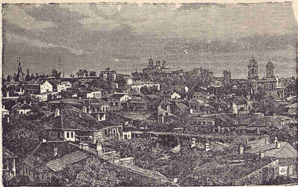
Vederea Bucureștilor la începutul secolului nostru.