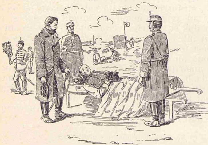
Domnitorul Carol vizitând ambulanța

Iar slăbia ori tăria în război nu însemnează numai puținime ori mulțime de oște — cu toate că mulți câștigă războaie cu mulțimea — ci mai ales tăria și slăbia de suflet. Pot să fie oștenii și mulți și iscușiți, că pierd războiul dacă sînt fricoși ori dacă n'au căpetenii cum se cade și dintru asta se încurcă, ori nu sînt ascultători poruncilor, ori târzi, ori se bat numai cu jumătate inima și nu le pasă dacă pierd sau dobîndesc.