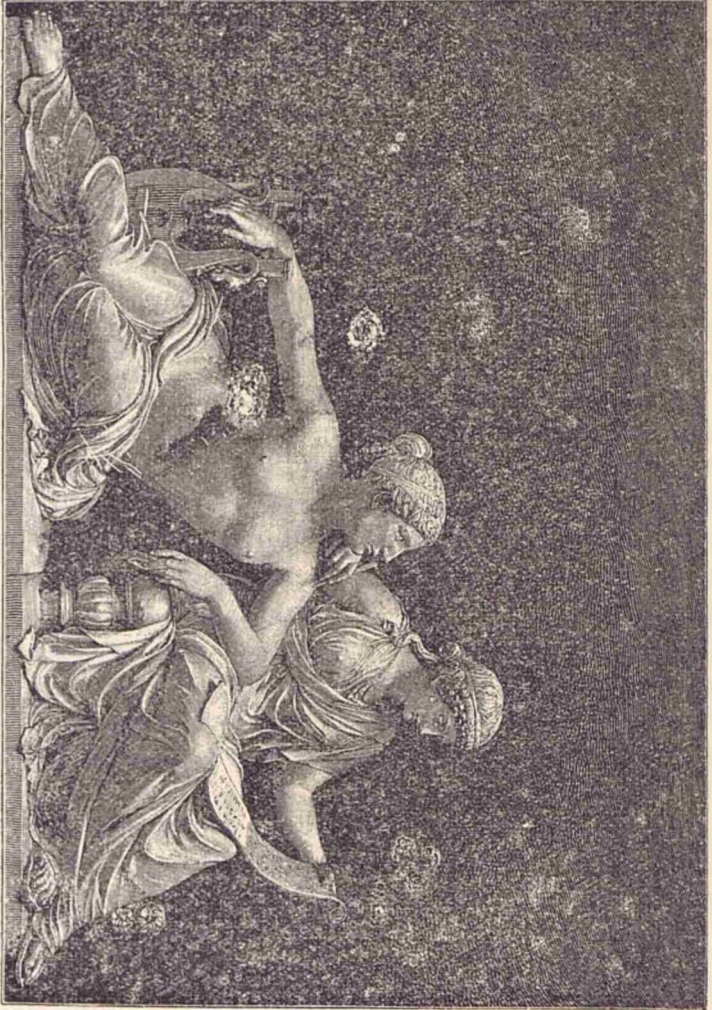
Musica și Poezia (Tablă alegoric.)