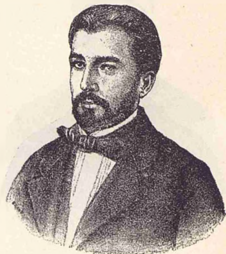
Dimitrie A. Sturdza.