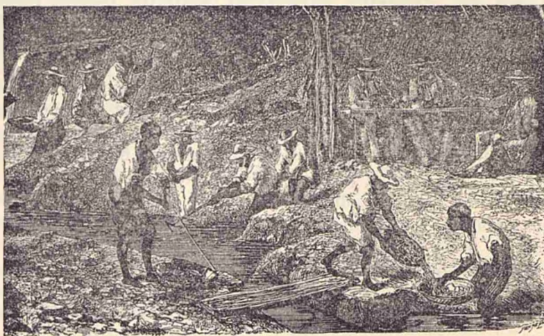
Spelarea nisipurilor cari conțin diamante.

Diamantele se caută și se găseesc ast-fel: Se ia nisipul în care se bănuiesce că sînt diamante și se pune pe nisce table înclinate. Pe aceste table, curge un curent de apă care ia