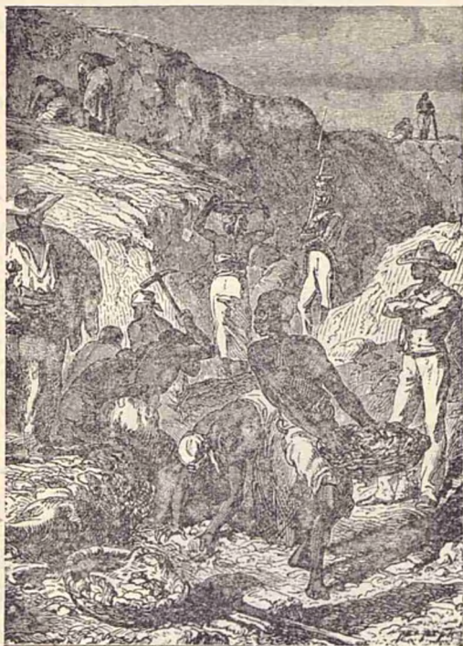
Căutarea diamantului în pământ.

Cei vechi întrebuințau diamantul în stare brută. Inven-