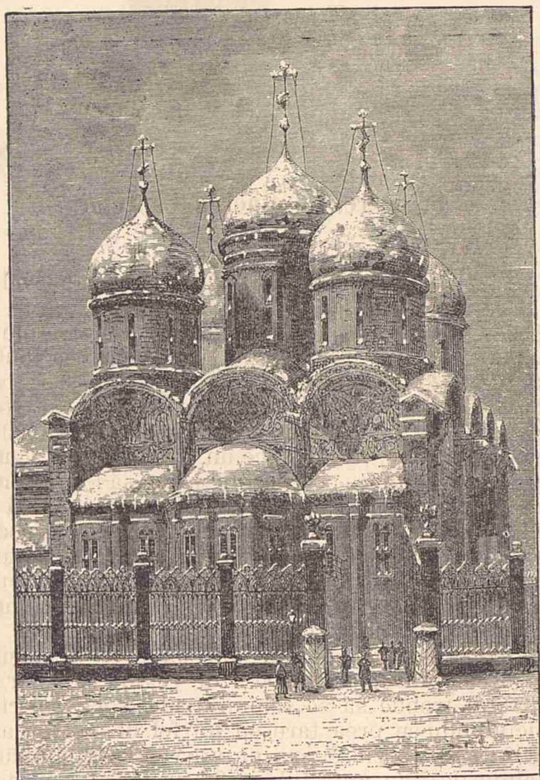
Biserica A'ormirea din Moseova, unde s'a încoronat Țarul.